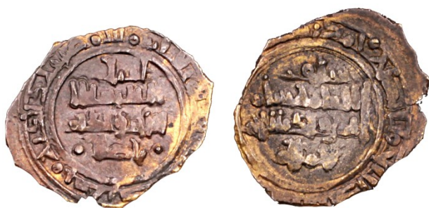
Figura 4: Fracción de dinar a nombre de Muqātil Sayf al-Milla de Tortosa.

pieza. Según consta en la moneda, se trataría de un dírham , sin embargo, el metal en que fue acuñada es oro, como el resto de las piezas del hallazgo del que forma parte, aunque en este caso de baja calidad. La pieza, a pesar de estar a la espera de una limpieza definitiva, conserva zonas donde es claramente apreciable el metal dorado, lo que supone una contradicción respecto a la leyenda del anverso y plantea un posible uso de un cuño hecho para emisiones de plata usado para acuñar oro. Además del metal en que fue acuñada, su peso de 0,9 gramos y sus dimensiones, alejan la posibilidad de que circulara como un dírham , y la sitúa en el intervalo de las fracciones de dinar acuñadas en al-Andalus con características metrológicas paralelas a las de las ruba'as fatimíes, junto a las que apareció en la vasija que contenía el tesorillo y que circularon por la zona oriental de la Península Ibérica durante el siglo XI.