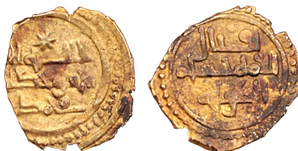
Figura 3: Fracción de dinar a nombre de 'Alī Iqbāl al-Dawla de Denia.

Se trata de un ejemplar de 1 gramo de peso, 13,8 mm de módulo, 0,6 mm de grosor y posición de cuños 10 (Figura 3). En ella figura el nombre de Muḥammad en la parte inferior de la leyenda del anverso. Este nombre, conocido en las monedas de plata, se documenta ahora por primera vez en las emisiones áureas. La única moneda de oro de 'Alī Iqbāl al-Dawla que recoge A.Vives (p.215, nº1313), presenta la misma leyenda del reverso que la pieza que aquí presentamos, pero difiere en la del anverso donde figura el nombre de 'Abd al-Malik dispuesto de manera partida entre la parte superior e inferior de la profesión de fe. A. Prieto, por su parte, publica cuatro tipos de fracciones de dinar 4 , pero en ninguna de ellas figura el nombre de Muḥammad.