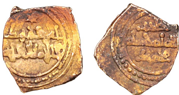
Figura 5: Fracción de dinar a nombre de Muḥammad ‘Aḍid al-Dawla de Calatayud.

Se trata de una moneda de 0,9 gramos de peso con un módulo de 13 mm, un grosor de 0,9 mm en su parte más gruesa y posición de cuños 4 (Figura 5). La disposición de su leyenda de anverso es una variante del tipo Vives 1251 / Prieto Vives 288, consistente en colocar en una sola línea el onomástico Ibn Hūd, que en el tipo referido aparece dividido por la profesión de fe: Ibn sobre dicha línea y Hūd en la parte inferior.