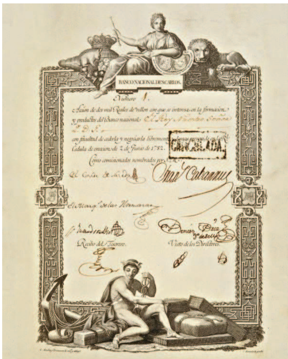
Primer billete español, 2000 reales 2 de Junio de 1782 N° de serie 1