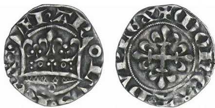
Fig. 6 : Exemple 3ème émission

Les deux émissions royales diffèrent par l'ornementation de la couronne.