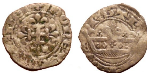
Fig. 2 : 21mm ; 1,01 g

La prise en compte du contexte historique et des informations numismatiques pour cette période nous permettra peut-être d'expliquer cette émission si particulière.