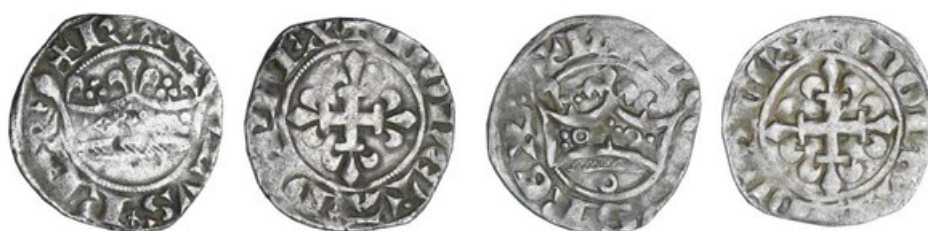
Charles IV (1322-1328) - Double parisis - 2ème émission 2 mars 1323

L'exemplaire présenté à la figure 3 est une imitation du Double Parisis émis par le roi de France Charles IV le Bel, le 24 juillet 1326 (3 ème émission).