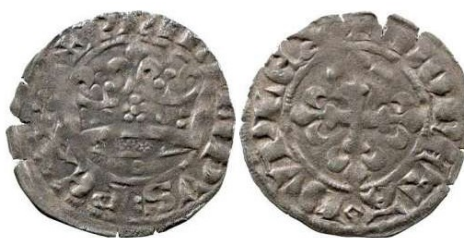
Fig. 7 : Double Parisis de Philippe VI émis le 2 mai 1328.