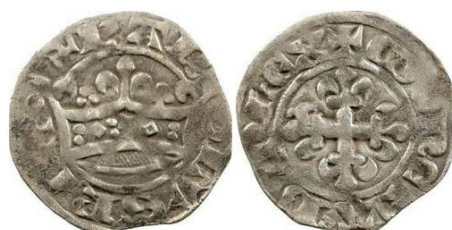
Fig. 5 : Exemple 2ème émission

Fig. 4 : Exemple des 2 émissions royales françaises pour comparaison.