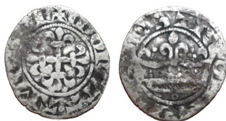
Fig. 3 : 21mm ; 1,12g

L'exemplaire de la Fig. 2 est de même type que le précédent, les légendes sont identiques.