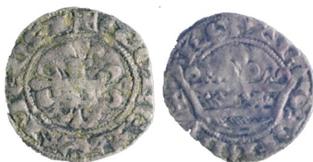
Fig. 1 : Monnaie faisant l'objet de cette note

La « monnaie à la couronne » faisant l'objet de cette étude (cf. Fig. 1) a été identifiée comme un Blanc Douzain correspondant à l'ordre de frappe du 3 juin 1349 pour l'atelier de Pont d'Ain et attribuée au comte de Savoie Amédée VI. Nommée Blanc Douzain à la couronne par les principaux numismates transalpins qui l'ont publiée, on verra qu'elle n'a pourtant pas les caractéristiques d'un Blanc Douzain. La monnaie peut se décrire ainsi :