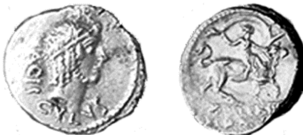
Fig.7 : le denier de L.VALERIVS ACISCULVS du trésor de Villette (RICHARD RALITE J.-C. et GENTRIC G.2014-b n°167).

DVRNACVS/DONNVVS. Elles étaient associées à des monnaies de la République romaine. La collection vue en 1985 comportait 167 monnaies de la République et 142 monnaies au cavalier. Cela correspond très probablement à un échantillon sélectionné pour sa qualité et sa représentation de l'ensemble. Le denier de L. VALERIVS ACISCULVS donne la date post quem de l'enfouissement : 45 avant J.-C. (Fig.7).