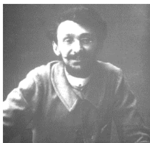
Fig. 1 : Autoportrait (collection Musée Dauphinois).

Hippolyte Müller (1865-1933) est un scientifique d'autrefois, autodidacte, qui s'est intéressé à beaucoup de sciences dont l'archéologie préhistorique, l'ethnographie de la zone alpine et la numismatique gauloise. Il crée en 1906 à Grenoble le Musée dauphinois qui possède la plus grande partie, mais pas la totalité de ses collections.