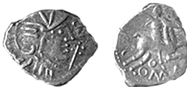
Fig.6 : Monnaie au cavalier, groupe A à légende BRI/COMA, issue du trésor de Ste-Blandine. (RICHARD RALITE J.-C. et GENTRIC G., 2014-a n°26).