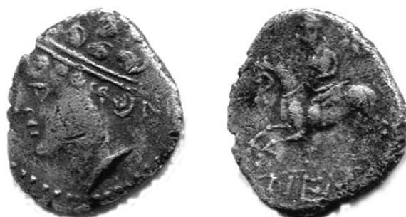
Fig.8 : drachme à légende NEMAY, trouvée dans le Gard, publiée sur la detection.com.

La question principale reste celle de savoir quels étaient les buts de ces si nombreuses émissions des monnaies au cavalier. Nous avons proposé de voir dans ces émissions en nombre considérable, des espèces alignées sur la métrologie romaine du quinaire, qui servaient à payer les troupes auxiliaires de cavalerie. Elles ont pu être émises au profit de peuples, tribus, cités, chefs ; les noms à terminaison latine ou gauloise qui figurent au droit et au revers désignent des personnages dont nous n'avons pas d'autres traces littéraires ou épigraphiques. Elles ont aussi pu être mises directement à la disposition des armées romaines comme l'ont été les innombrables émissions des monnaies ibériques, de typologie comparable. Sur ces dernières les légendes à l'exergue des revers renvoient à des peuples ou des cités, connus par ailleurs et on a parfois un second cheval, sans cavalier, qui accompagne le combattant variété qui ne se rencontre pas sur les séries émises en Gaule. (GOZALBES M. et TORREGROSAI J. M., 2014). De même, pour les monnaies à légende NEMAY la référence à Nîmes est évidente et le cavalier du revers correspond à ceux des deniers ibériques (Fig.8).