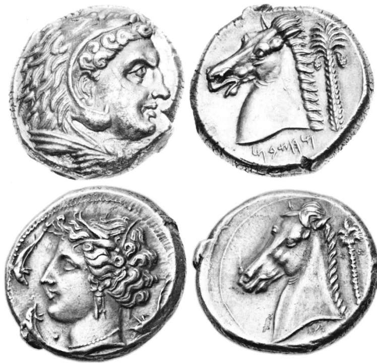
Fig.5 : Tétradrachmes puniques (RICHARD RALITE J.-C. et GENTRIC G. 2014-c).