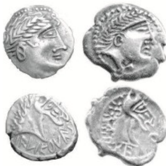
Fig. 3 : Monnaies « au buste de cheval » issues de collections publiques et privées. (RICHARD RALITE J.-C. et GENTRIC G., 2014-c)

La description de ces monnaies est bien connue, avec à l'avvers, une tête à droite et au revers un buste de cheval, accompagné par la légende en caractères nord-italiques KASIOS ou IALKOVESI (VAN DER WIELEN Y., 1999 1a-c et 1d).