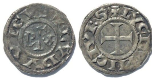
Figure 11 : Denier de Louis au titre royal, Lyon, Ag, 1.55g, 21mm (MBAL, trouvé à Chaley dans le Bugey)