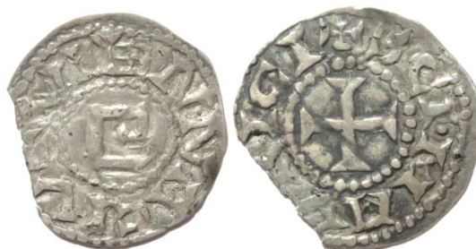
Figure 21 : Denier au nom de saint Maurice et à la lettre G, Vienne, Ag, 1.22g, 23 mm, (MBAL)

A) + VIENNA CIV , G dans le champ, (Cité de Vienne, initiale de Conrad ?)