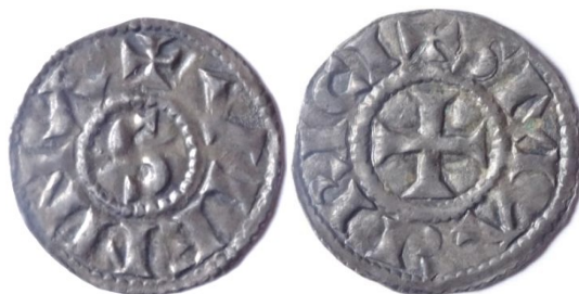
Figure 18 : Denier au nom de saint Maurice, Vienne, Ag, 1.29g, 20 mm. (BnF)

ne permettent pas de retracer l'évolution de ce conflit, mais Sobon finira par l'emporter, Rostaing ne souscrivant plus en qualité d'archevêque et se recentrant sur ses possessions familiales. C'est peut être lorsque Sobon fut définitivement assuré du siège archiepiscopal que la période de transition monétaire prendra fin. Un nouveau type est émis dans des quantités plus importantes, le type au S.