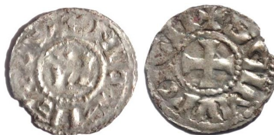
Figure 17 : Denier au nom de saint Maurice, Vienne, Ag, 1.10g, 22 mm (Musée de Vienne)

Nous insérons ici un denier inédit, trouvé au musée de Vienne. C'est un type de transition, pour lequel seule l'obole avait été recensée par Villard, comme faisant partie de la collection Manteyer. Cette fois ci, le vocable « SANCTI MAVRICI » est isolé, sur une face. La légende est très déformée. C'est une monnaie très fruste, de mauvais aloi, portant encore les deux lettres VI dans le champ, mais dont le style est déjà plus proche des monnaies ultérieures que nous abordons ci-dessous, et probablement frappée sous l'épiscopat de Sobon.