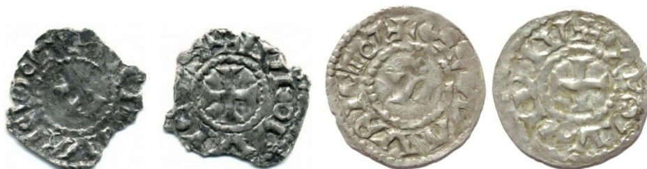
Figure 14 : Denier au nom de Louis et de saint Maurice, Vienne, Ag, 1.01g, 20 mm / 1.33g, 21.5 mm (collection privée / MBAL, exemplaire de référence Poey d'Avant 4814)