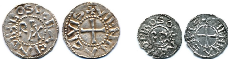
Figure 5 : Denier et obole de Boson, Vienne, Ag, 1.38g, 20mm / 0.72g, 16mm (collection privée)

connus à l'heure actuelle pour avoir émis à son nom sont Arles, dont une seule monnaie est recensée et conservée à Montpellier, et Vienne, pour lequel le monnayage semble avoir été nettement plus abondant. En effet, à la fois des deniers et des oboles nous sont parvenus. En tout état de cause, la documentation historique que nous venons d'examiner nous incite à placer la date d'émission à Vienne de ces monnaies entre octobre 879 et septembre 882.