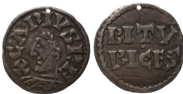
Figure 9 : Denier de Charles le Chauve, Bourges, Ag, 1.36g, (BnF)

Pour conclure sur les monnaies viennoises de Boson, Mermet décrit dans son Histoire de la Ville de Vienne , un autre type de denier au nom de Boson. Il s'agirait d'un denier portant la tête du roi avec l'inscription « BOSO REX », tandis que le côté croix porterait la légende des deniers présentés ci avant avec la légende « VIENNA CIVIS » 12 . Cette monnaie n'a pour le moment pas été retrouvée. Poupardin, la considère comme suspecte, n'étant connue ni de Prou, ni de Gariel. A notre avis, son existence n'est pas impossible. Elle serait à rapprocher des monnaies au buste que Charles le Chauve a émis à Bourges capitale du royaume d'Aquitaine, et portant au droit la légende CARLVS REX. Puisque Boson s'est bien inspiré des deniers au type de l'édit de Pîtres, pourquoi n'aurait-il pas pu également imiter celles au buste, dans sa principale cité ?