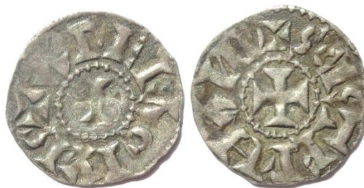
Figure 20 : Denier d'Arles au I, Arles, Ag, 1.11g, 20 mm (MBAL)