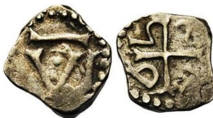
Figure 19 : Denier pré carolingien, Vienne, Ag, (Coll. Priv.)

La signification la plus vraisemblable de cette initiale demeure en réalité « SEDES », pour marquer l'emprise épiscopale sur la monnaie. Des deniers pré-carolingiens émis au nom de Vienne portaient déjà ce mot en toutes lettres. Le dixième siècle ne fait que constater le retour de l'atelier monétaire dans le giron archiepiscopal, comme si une parenthèse carolingienne se refermait.