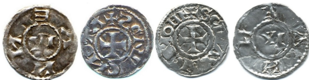
Figure 16 : Deniers au nom de saint Maurice, Vienne, après 928, Ag, 1.05g, 20 mm / 1.29g, 21mm (Coll. priv.)

A) + SCI MAVRIC MONE (variantes), croix pattée (Sancti Maurici Moneta) R) VIENNA