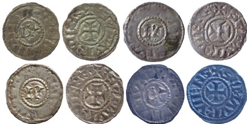
Figure 15 : Les quatre deniers connus au nom de Louis et de saint Maurice, Vienne, Ag, [1.23g, 1.20g, 1.23g, 1.23g / 21mm] (MBAL, BnF, Musée de Vienne, Cabinet des Médailles de Marseille)

Sur les quatre exemplaires que nous avons recensés, dans les musées de Lyon, Vienne et aux Cabinets des Médailles de Paris et Marseille, il y a 2 coins de pile (Lyon/Marseille et Vienne/BnF) et 2 coins de revers (Lyon/Vienne/BnF et Marseille). Cette constatation laisse à penser à un monnayage somme toute assez restreint. Le denier du Musée des Beaux-Arts de Lyon a été trouvé à Lyon au XIXe siècle, en compagnie du premier type ecclésial présenté ci-dessus. Henri Morin-Pons, mentionne d'ailleurs que cinq deniers de ce type avaient été découverts à cette occasion. Il y a fort à parier que nous ayons ici rassemblé quatre de ces cinq exemplaires.