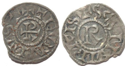
Figure 23 : denier au nom de Thibault (957/58-1000), Vienne, Ag, 0.96 g, 19 mm (MBAL)

D'ailleurs, quelques années plus tard, ce « R » va de nouveau apparaître, mais cette fois en plein champ, toujours du côté de la légende de saint Maurice. Ces monnaies seront les seules sur lesquelles les archevêques de Vienne apposeront leur nom en toutes lettres. En effet, Thibault, imposé, semble-t-il après quelques difficultés, sur le siège archiepiscopal par le roi Conrad, n'hésitera pas à affirmer sa possession de la monnaie en remplaçant la légende anonyme par la mention de « Thibault, évêque (de Vienne) » ( Theubaudus, (Vienna), praesul ). Au revers, toujours cette mention de saint Maurice, accompagnée de la lettre R qui occupe le champ, très probablement une allusion au pouvoir du roi Conrad sur la cité, pouvoir désormais bien établi. C'est donc paradoxalement au moment où l'archevêque peut s'affirmer clairement et signer le monnayage qu'un signe rappelle au revers à qui il doit sa présence sur le siège viennois.