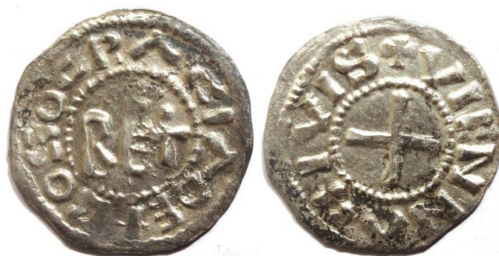
Figure 8 : Denier de Boson, Vienne, Ag, 1.76g, 21mm, (Musée de Vienne)

Remarquons enfin que le Musée de Vienne conserve un denier pour lequel la légende commence à six heures au lieu de neuf. Le style de l'écriture est plus tardif, il a certainement été frappé ultérieurement, lorsque le type de Boson était bien implanté dans la circulation.