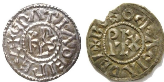
Figure 6 : Passage du denier de Charles le Chauve à celui de Boson (BnF, coll.priv.), côté pile.

Cependant, une légère modification de l'avvers a été nécessaire pour arriver à insérer cette nouvelle légende. Le monogramme est supprimé, le nom du roi passant dans la légende, et est remplacé par le mot REX , auquel on a donné une forme étrange, le R et le E étant nettement plus grand que le X , afin d'imiter les branches du monogramme. Sur les deux types, la légende commence à neuf heures, et afin de parfaire l'illusion, certaines lettres conservent exactement leur place dans la légende sur les deux types. Les revers demeurent strictement identiques, avec le nom de la ville et la croix ( VIENNA CIVIS ). Ainsi, les nouvelles monnaies pourront se fondre très rapidement dans la circulation, sans trop éveiller les soupçons des utilisateurs.