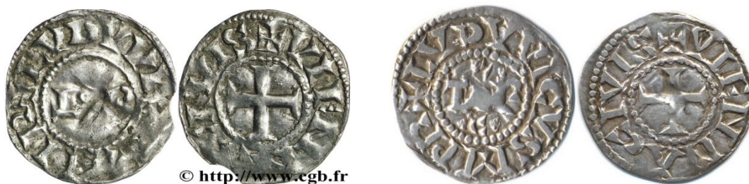
Figure12 : Deniers de Louis empereur, Vienne, Ag, 1.15g, 19mm / 1.40g, 20mm.