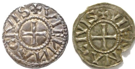
Figure 7 : Passage du denier de Charles le Chauve à celui de Boson : les côtés croix sont identiques

Remarquons enfin que le Musée de Vienne conserve un denier pour lequel la légende commence à six heures au lieu de neuf. Le style de l'écriture est plus tardif, il a certainement été frappé ultérieurement, lorsque le type de Boson était bien implanté dans la circulation.