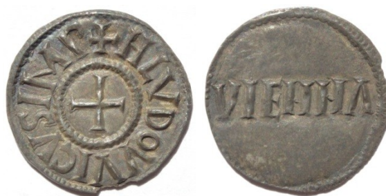
Figure 2 : Denier de Vienne de Louis le Pieux (période 818-822) Ag, 1.74g, 21mm (MBAL)

Sur le plan monétaire, cette période semble a priori caractérisée par une très faible activité des ateliers régionaux, et notamment à Vienne. En effet avant 870 et l'implantation de Charles le Chauve, les dernières monnaies émises au nom de la ville que l'on connaisse sont celles de Louis le Pieux pour la période 818-822. Lothaire Ier et Lothaire II n'ont, semble-t-il, pas émis à leur nom, ni dans la cité, ni dans le royaume de Provence. Il est possible que Charles de Provence ait émis à Arles des deniers portant la légende « CARLVVS REX », mais il est difficile de déterminer si ces monnaies sont à attribuer à Charles ou à son oncle Charles le Chauve. En revanche, ce dernier reprend les émissions monétaires lorsque la région passe dans son giron. Probablement dès 871, sous le contrôle du comte Boson, des deniers au type de l'édit de Pîtres de 864 sont frappés à Vienne et à Lyon.