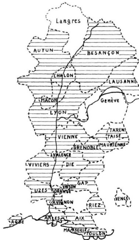
Figure 4 : Les diocèses dont les prélats participèrent à l'élection de Mantaille en 879 5

reconnaitre. Il se fait élire roi lors d'une assemblée de Grands à Mantaille le 15 octobre 879, sur un espace correspondant peu ou prou à l'ancien royaume de Charles de Provence, probablement sans la partie orientale de la Provence mais en y ajoutant cependant l'Autunois, Mâcon, Chalon et Besançon. Après son élection, Boson est sacré à Lyon par l'archevêque Aurélien 3 . Il choisit cependant de s'installer à Vienne 4 .