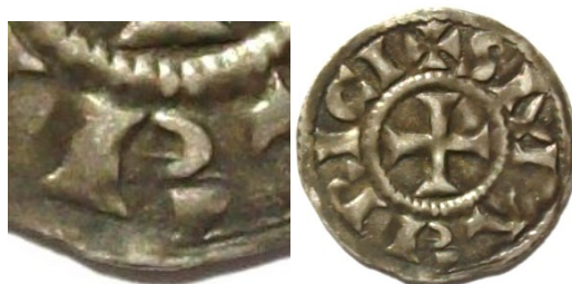
Figure 22 : Le petit R, dissimulé dans la légende

D'ailleurs, quelques années plus tard, ce « R » va de nouveau apparaître, mais cette fois en plein champ, toujours du côté de la légende de saint Maurice. Ces monnaies seront les seules sur lesquelles les archevêques de Vienne apposeront leur nom en toutes lettres. En effet, Thibault, imposé, semble-t-il après quelques difficultés, sur le siège archiepiscopal par le roi Conrad, n'hésitera pas à affirmer sa possession de la monnaie en remplaçant la légende anonyme par la mention de « Thibault, évêque (de Vienne) » ( Theubaudus, (Vienna), praesul ). Au revers, toujours cette mention de saint Maurice, accompagnée de la lettre R qui occupe le champ, très probablement une allusion au pouvoir du roi Conrad sur la cité, pouvoir désormais bien établi. C'est donc paradoxalement au moment où l'archevêque peut s'affirmer clairement et signer le monnayage qu'un signe rappelle au revers à qui il doit sa présence sur le siège viennois.