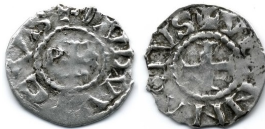
Figure 10 : Obole de Louis au titre royal, Vienne, Ag, 0.52g, 15mm (coll. priv.)

Le monnayage personnel de Louis à cette période est dans la continuité de celui de son père. En effet, il adapte le type émis par ce dernier en apposant son nom et en supprimant la référence à la grâce divine. Ce type est émis non seulement à Vienne, mais également à Lyon et Arles. En revanche, les quantités frappées semblent avoir été très faibles. Aujourd'hui, seule une obole est connue pour Vienne, un denier pour Arles, et quatre deniers pour Lyon, trouvés dans le Bugey, dont un seul est conservé au Musée des Beaux-Arts.