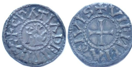
Figure 3 : Denier de Vienne de Charles le Chauve, au type de l'édit de Pîtres (après 864, vraisemblablement dès 871 à Vienne) Ag, 1.52g, 20mm (MBAL)

A) + Monogramme KRLS , CRATIA DEI REX , ( Charles, par la grâce de Dieu, roi, )