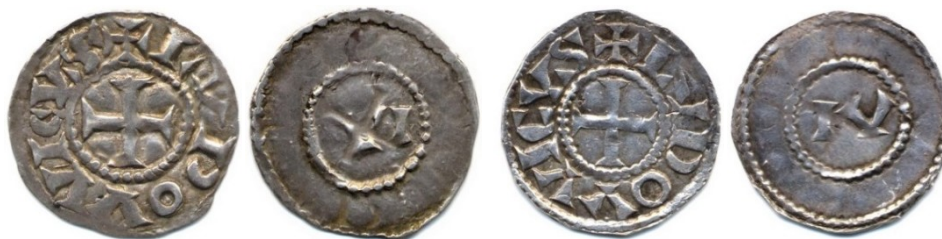
Figure 13 : Deniers au nom de Louis, Vienne, Ag, 20mm, 1.39g / 20mm, 1.35g. (Collection privée)

sans aucun titre, du côté croix. Le côté pile est extrêmement simplifié également, ne portant plus que les initiales VI ou IV, abrégatives de Vienne. Ces monnaies quasiment sans légende ne seront pas une spécificité viennoise, elles seront également émises pendant longtemps à Auxerre, possession de Richard le Justicier, l'oncle de Louis. Il s'agit donc vraisemblablement d'une « mode » qui s'est développée dans les premières décennies du Xe siècle.