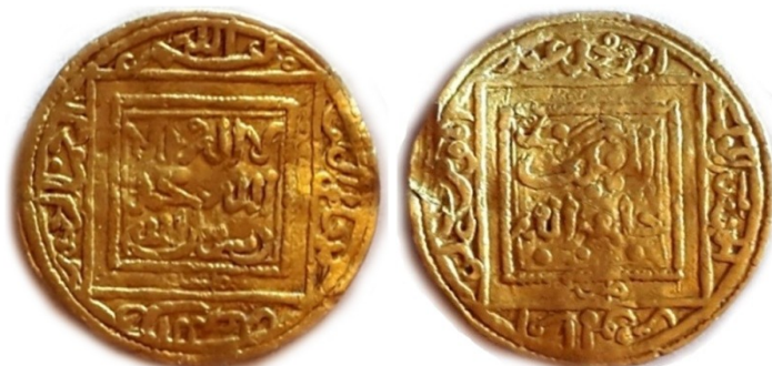
Peso 1,13 gr diámetro 15 mm

Semidinar o Cuarto de Dobra Almohade de ceca Fez del Califa 'Abd Al Mu'men Ibn 'Ali.524-558 H / 1129-1162 J.D.