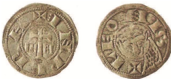
Museo Arqueológico Nacional

Las interpretaciones que Panel realiza son acordes con la ausencia de información publicada hasta entonces y de la falta de conocimiento de numerario de este período. Las piezas son generalmente escasas y, aunque derivan de las emisiones francesas, presentan con él algunas diferencias. En este último caso, la leyenda del lado del león presenta en algunas variantes la letra B, de menor tamaño que el resto de la leyenda. En la numismática actual, ha llevado a preguntarse y no responderse si se trata de una marca de taller monetario (en este caso sería, de serlo, de Burgos). Sin embargo, Panel se pregunta y tampoco se contesta si responde a la inicial de uno de los reyes castellanos que usaron el título de emperador.