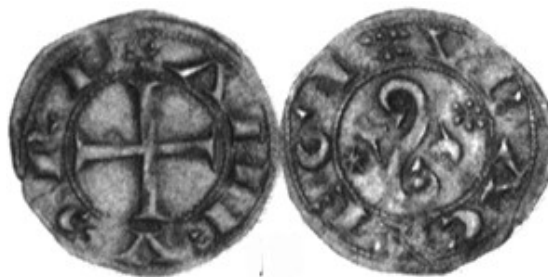
Áureo, noviembre de 1997

La segunda presenta una cruz idéntica a las emisiones de 1103-1108 y la leyenda ANFVSREX mientras que en el reverso la leyenda VRACAREGI encabezada por dos líneas de cuatro puntos cada una rodea un tipo formado por un símbolo central en forma de S a cuyos lados se disponen una estrella de cinco puntas y un círculo formado por seis puntos.