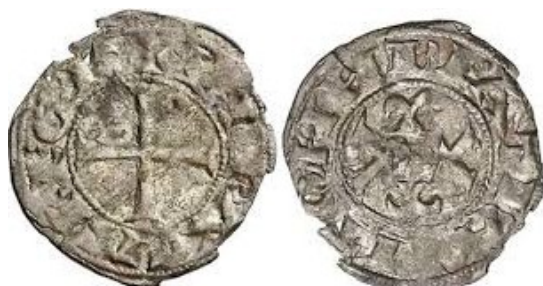
Áureo, diciembre de 2013

El primer tipo a destacar es coincidente con el anterior. Podemos mencionar la existencia de tan sólo tres ejemplares conocidos expresivos de una acuñación muy limitada. En este caso, el genitivo de la leyenda hace perfecta alusión a su emisor en dos variedades: