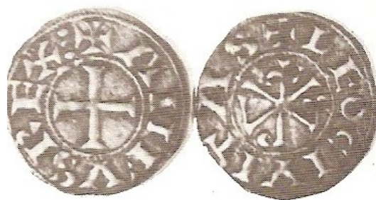
Rueda Sabater, 1991

La segunda descripción es la siguiente, que describe como conocida, pero no ubica en el monetario sino en el Museo D. De los Infantes de la Iglesia Metropolitana y que no se encuentra presente en el inventario del MAN 4 .