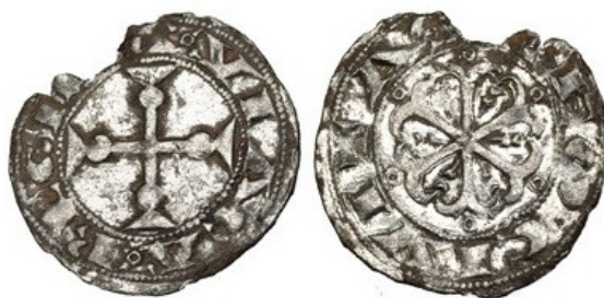
Vico, noviembre de 2014

Un último tipo responde a un estilo más evolucionado, muestra una cruz adornada en los extremos y la leyenda VRACAREGINA, mientras que en el reverso la leyenda LEOCIVITAS y una cruz de seis brazos adornada en sus extremos, concluidos en círculos que recuerda a los rosetones y que encontramos en la cripta de la iglesia de San Antolín de Palencia.