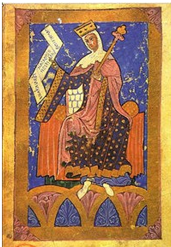
Urraca. Tumbo A. Catedral de Santiago

Por otro lado, la disposición de la leyenda permite que el tipo asuma una forma ovalada o de avellana propia de otras representaciones del románico. El tipo comentado supone una innovación en el numerario del período y no sólo del castellano. Habrá que esperar varias décadas para contemplar otras especies leonesas y castellanas que muestran una figura real de cuerpo entero, sea sentado, de pie o a caballo.