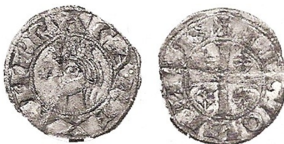
Herrero, febrero de 2003

La segunda presenta una cruz idéntica a las emisiones de 1103-1108 y la leyenda ANFVSREX mientras que en el reverso la leyenda VRACAREGI encabezada por dos líneas de cuatro puntos cada una rodea un tipo formado por un símbolo central en forma de S a cuyos lados se disponen una estrella de cinco puntas y un círculo formado por seis puntos.