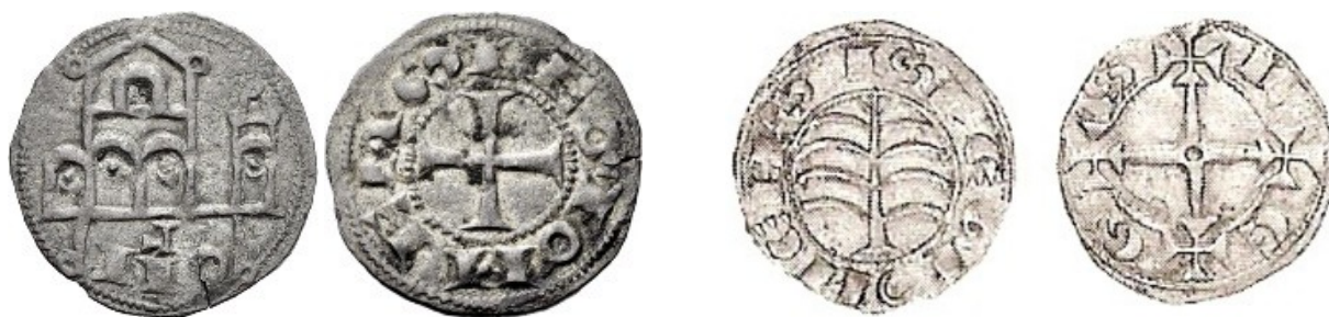
Dineros anónimos con una iglesia y con simetría. Vico, junio de 2012 y Herrero, octubre de 2001

elementos simétricos, en forma de árbol en anverso y con cruz rematada en cruces en el reverso y leyenda LEGS, de datación ambos incierta.