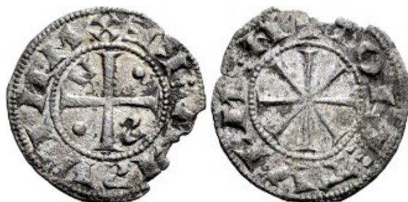
Dinero de Alfonso Raimúndez, Sahagún. Vico

En cuanto a los aspectos organizativos, las emisiones del s. XII se caracterizan por el monopolio real de las emisiones que es cedido parcialmente a unas pocas autoridades religiosas. Alfonso VI había concedido al obispo compostelano un derecho de acuñación en 1108 que la reina Urraca no renovó pero que sí hicieron sus sucesores en 1171, 1182 y 1193. Por su parte, en 1116 la reina concedió al abad de Sahagún un derecho parcial a la acuñación confirmado en 1119 por Alfonso Raimúndez, a la postre Alfonso VII, en vida de su madre. Y antes de 1125 la reina Urraca concedió al obispo y a la iglesia de San Antolín de Palencia en derecho a acuñar moneda que conocemos por una bula papal. De esta manera, sabemos que en este período, además de la reina acuñaron o ejercieron su propio poder monetario su hijo Alfonso Raimúndez, el abad de Sahagún y el obispo de Palencia, a los que cabe añadir Alfonso el Batallador de Aragón, con la duda del obispo compostelano, capaces de contratar con los monederos que se desplazaban por el reino, originarios en un comienzo del sur Francia y del norte de Italia, a los que entregaban la plata y los cuños y encargaban la emisión de una moneda. Puede añadirse que los documentos del período mencionan la presencia de monederos en León, Santiago, Toledo, Palencia, Burgos y Sahagún con anterioridad a 1125 y en Salamanca, Segovia y Ávila en los años siguientes.