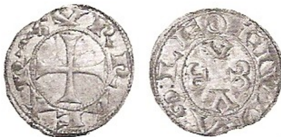
Herrero, febrero de 2003

Un último tipo responde a un estilo más evolucionado, muestra una cruz adornada en los extremos y la leyenda VRACAREGINA, mientras que en el reverso la leyenda LEOCIVITAS y una cruz de seis brazos adornada en sus extremos, concluidos en círculos que recuerda a los rosetones y que encontramos en la cripta de la iglesia de San Antolín de Palencia.