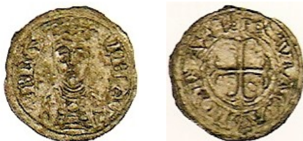
Áureo, marzo de 2004

Dos series merecen un tratamiento especial, formadas por ejemplares únicos y muestran el busto de frente de la reina con la misma corona cuadrangular. La primera tiene la leyenda REGINA en el anverso, la segunda, con una cruz idéntica a la del primer dinero, tiene la leyenda VRACAISPAREX.