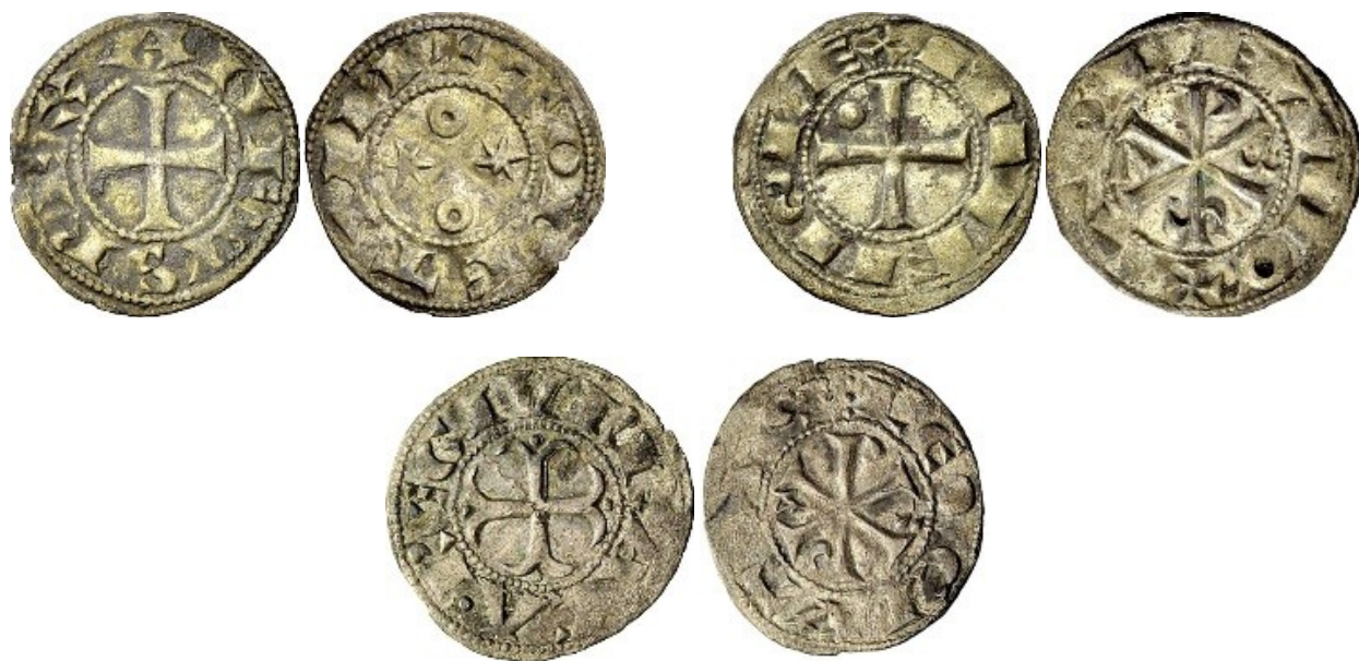
Emisiones de 1088, 1103 y 1108. Vico, subastas de junio y octubre de 2012

partir de este momento de las fronteras tanto los grandes monederos encargados de la fabricación de moneda como el producto de su trabajo. Esta circunstancia explica porqué las emisiones de 1108, la de Gelmírez del mismo año y las de los sucesores de Alfonso VI se producen en cantidades en general escasas.