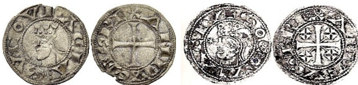
Emisiones segovianas de Alfonso de Aragón y Alfonso Raimúndez.

Una tercera serie a reseñar presenta el busto coronado de la reina a la izquierda con corona y una estrella delante, siendo la leyenda VRRACAREXA. El tipo del reverso es la cruz, en cuyos cuarteles se presentan cruces de tamaño pequeño siendo su leyenda LEGIONENSIS. En 2010 se daba cuenta de cuatro ejemplares conocidos, dos de ellos originarios de la colección Hungtinton, con dos cuños de anverso y cuatro de reverso, muestra de una emisión muy poco voluminosa que pudo superar los 70.000 ejemplares o incluso exceder de 100.000. Su indudable analogía, aun sin coincidencia absoluta de cuños, con ejemplares acuñados en Segovia por Alfonso de Aragón y por Alfonso Raimúndez nos conduce a esta ubicación geográfica. Aunque las acuñaciones que se desarrollan en las ciudades no tiene porqué coincidir con la presencia del monarca, puede recordarse que la reina visitó esa ciudad en noviembre de 1116, fecha en la que reconoce a su hijo como rey de esta ciudad. En febrero de 1114 la ciudad había caído en manos de Alfonso I de Aragón de manera que las series con tipos coincidentes pudieron corresponder a este período de tiempo.