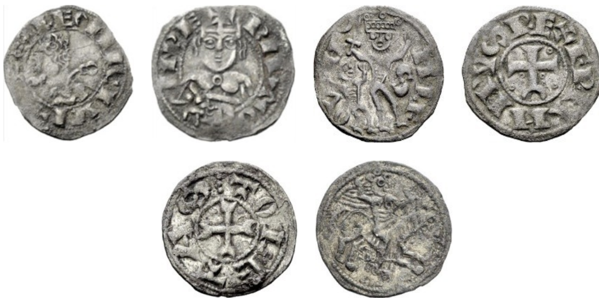
Dineros de Alfonso VII sentado en trono con sobredimensionamiento del tronco en relación con las extremidades inferiores (h. 1140), de Alfonso VIII de Castilla (1157-1162) y de Alfonso VIII de Castilla (h. 1162).

Por otro lado, la disposición de la leyenda permite que el tipo asuma una forma ovalada o de avellana propia de otras representaciones del románico. El tipo comentado supone una innovación en el numerario del período y no sólo del castellano. Habrá que esperar varias décadas para contemplar otras especies leonesas y castellanas que muestran una figura real de cuerpo entero, sea sentado, de pie o a caballo.