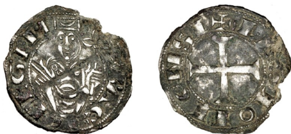
Vico, marzo de 2016

Dos series merecen un tratamiento especial, formadas por ejemplares únicos y muestran el busto de frente de la reina con la misma corona cuadrangular. La primera tiene la leyenda REGINA en el anverso, la segunda, con una cruz idéntica a la del primer dinero, tiene la leyenda VRACAISPAREX.