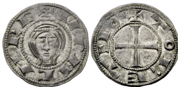
Vico, junio de 2012

La segunda serie a reseñar, posiblemente coetánea a la precedente o ligeramente posterior en el tiempo. El anverso muestra un busto de frente con un tocado, aparentemente sin coronar y con la leyenda VRRACARE mientras que el reverso presenta una cruz idéntica a las series de 1103-1108 y la leyenda TOLETVO. Es la serie más representada en las colecciones, de manera que en 2010 se habían publicado 29 ejemplares con 15 cuños de anverso y 12 de reverso, de suerte que la serie pudo alcanzar los 200.000 ejemplares. Con la anterior, es la única serie que alcanza cifras mínimamente significativas, de manera que las siguientes se acuñan en proporciones muy inferiores. A diferencia de la serie que la precedía, incorpora en el numerario leonés un elemento iconográfico de verdadero interés, el busto, en este caso frontal y guardando la debida simetría. Las señales de emisión nos permiten diferenciar las siguientes variantes: