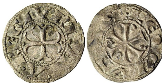
Vico, noviembre de 2012

En la exposición se mencionarán el número de ejemplares documentados en mi trabajo Emisiones monetarias leonesas y castellanas de la Edad Media: organización, economía, tipos y fuentes , 2010 en el que se recogen los datos estudiados en la tesis doctoral con el mismo título en 2008 sobre un estudio de las monedas comprendidas entre 1108 y 1200 con pocas excepciones y que se encontraban publicadas desde el s. XIX hasta ese momento, así como las divulgadas en catálogos de ventas y subastas públicas de todas las casas comerciales, con indicación de su peso, imagen y número de cuños identificado. La enajenación reciente de nuevos ejemplares o algunos ya conocidos pero deficientemente fotografiados permite mejorar y actualizar el catálogo. A todos estos se añaden nuevos ejemplares.