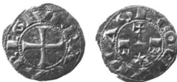
Biblioteca Nacional de París, Rueda, 1991

El matrimonio de la Reina en 1109 con el Rey Alfonso de Aragón, anulado finalmente en 1114, trajo consigo una importante repercusión política, una convivencia muy limitada, diversos enfrentamientos y dos emisiones diferentes de las que nos quedan tan sólo un ejemplar de cada una. Una primera muestra la cruz y la leyenda VRRACAREGI en una cara y la expresión LEOCIVITAS en la otra. La extraña disposición del reverso coloca una cruz y un sol o una estrella, además de dos letras E o más bien dos coronas que se aprecian invertidas si se observa la cruz.