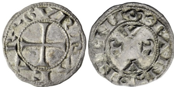
Vico, junio de 2012

A continuación, se tratan las emisiones palentinas desarrolladas en el ejercicio de la concesión parcial del derecho a acuñar.