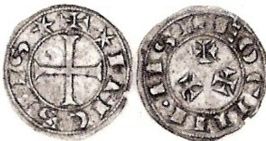
Dinero con leyenda IHESVS. Áureo, noviembre de 1998

La siguiente serie, dispone una cruz en el anverso en cuyos cuarteles se escribe BEAT con la leyenda ANTONIN a su alrededor. En el reverso se sitúan tres cruces con un punto en el centro respondiendo a una disposición idéntica a una serie anónima de este período. En esta serie, la leyenda se lee de manera inversa y es PALENTIA. La serie con la que presenta analogía tipológica presenta una cruz en el anverso y la leyenda IHESVS, con la lectura del reverso LEOCIVI·IIS. Aunque conocemos algún tesoriillo con estas monedas en la zona del Camino de Santiago, resulta complicado asignar esta serie sin mención del acuñador a ninguna de las autoridades religiosas emisoras, sea el obispo palentino sea el abad de Sahagún.