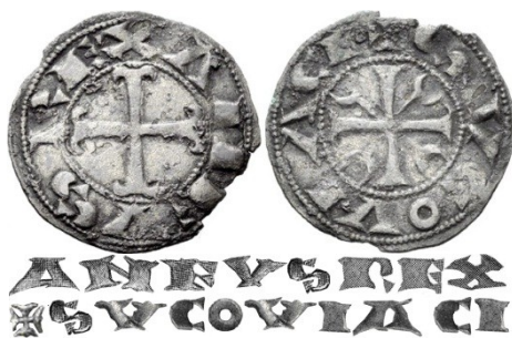
Fig.1: Dinero de Alfonso VIII acuñado en Segovia

En cuanto a las leyendas de las piezas, Sancho plasmó una abreviatura monetar -“ Sancius Rex/Tol Eta ”- similar a la que habitualmente utilizaba en su cancillería: “ Sancivs Rex Toletu et in tota Castella —Sancho Rey de Toledo y en toda Castilla” 5 -, cargando en apariencia la parte alusiva al toponímico de un significado anfibológico, tanto alusivo a la ciudad imperial como al propio reino y sus núcleos de población principales 6 . Ello encaja perfectamente con el hecho de ser él, como primogénito del rey que era, quien heredó el teóricamente más importante, o al menos el más amplio y con más capacidades expansivas, de los dos reinos en que Alfonso VII dividió sus territorios al morir, es decir, el reino de Castilla. Esta situación implicaba, por primera vez e indirectamente, una mayor preeminencia del trono castellano -con Toledo a su cabeza como cuna primigenia que fue del reino visigótico-, sobre el leonés —que fue cedido a la vez al segundogénito del rey Alfonso, Fernando II-, que pese a englobar a los originarios reinos de Asturias y de Galicia, pasaba de facto a un plano secundario en cuanto a relevancia territorial y política, aunque fuese en él donde en puridad residía aún el “ fecho de imperio ”.