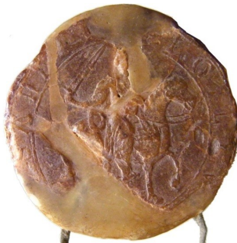
Fig.3: Sello céreo de Sancho III Archivo de la Catedral de Palencia, arm. 3, leg. 1, núm. 20 (Nuevo 272)

Por otro lado y ahondando en el estudio epigráfico de las leyendas, es necesario decir que en la primera de las emisiones se antepone el nombre del monarca a la titulación, invirtiéndose el orden en la segunda, a la par que se abrevia el nominativo del nombre del monarca con un apóstrofo que en la paleografía de la época tenía el valor de la terminación del nominativo en “VS”. En ambos tipos, el monarca decidió mostrar su retrato regio esquemático de perfil a derecha –siempre coronado y con poblada barba que debía ser característica definitoria de su personalidad–efigiándose, por tanto, como ya lo habían hecho su padre Alfonso VII, y sus predecesores: Urraca y Alfonso VI. Con ello, no se hacía sino confirmar la continuidad tipológica hereditaria de los primeros reyes cristianos peninsulares en la persona de este nuevo rey castellano. Sin embargo, no se trata éste de un acto peregrino, pues en realidad es la primera vez en la numismática medieval castellano-leonesa en que la imagen del busto regio se graba orientándola hacia la derecha, en un claro gesto que denota el ánimo de innovación monetaria que tenía Sancho III para el reino de Castilla: hasta ese mismo instante, toda representación monárquica medieval había sido reflejada e idealizada bien de frente o bien en escorzo lateral mirando a la izquierda 9 .