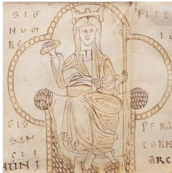
Signo Regio de Sancho III en un Privilegium conservado en el Archivo de la Catedral de Osma.

Ogronii ”, corroborando apenas un año después –el 27 de enero de 1151- el importante Tratado de Tudején con similar titulación. Alfonso VII le dio el espaldarazo definitivo cuando, aún en vida, le entregó la dignidad real nombrándole por su propia mano caballero en Valladolid, el 24 de marzo de 1152. A partir de ese instante Sancho III prácticamente ya no se separaría del Emperador, siguiéndole entre abril y septiembre de ese mismo año por Cuellar, Guadix, Lorca, Almería y, de regreso de esta última expedición militar, también en Toledo. La corona aún no era oficialmente suya, pues la seguía manteniendo su padre para sí, pero a los efectos, su jurisdicción sobre los territorios castellanos era ya en la práctica total y absoluta. Así, terminaría recibiendo los definitivamente a la muerte de don Alfonso en La Fresneda (Ciudad Real) el 21 de agosto de 1157. Pese a encontrarse Sancho temporalmente emplazado en Baeza en ese instante, volvió de inmediato a Toledo, para dar cristiana sepultura al cuerpo de su padre en la iglesia Mayor de la ciudad del Tajo, bajo la bendición de su arzobispo Juan, en cuya catedral le organizó sentidas, intensas y luctuosas exequias.