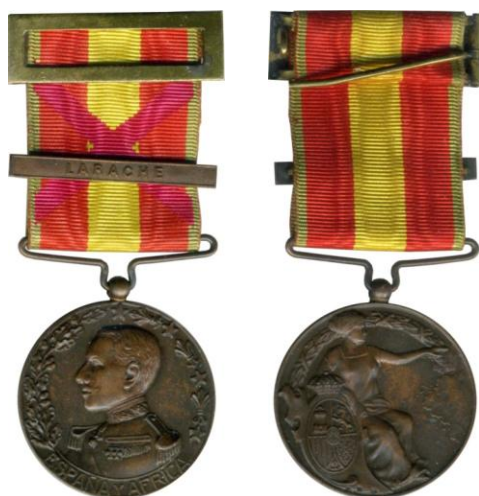
Fig. 4. Modelo D1 Colección Carlos Lozano Liarte Asa oblonga. Cinta con aspa roja tejida. Pasador LARACHE