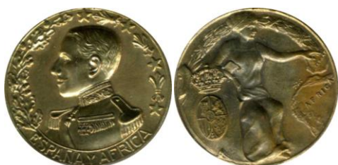
Fig. 17. Modelo D5 Colección Carlos Lozano Liarte