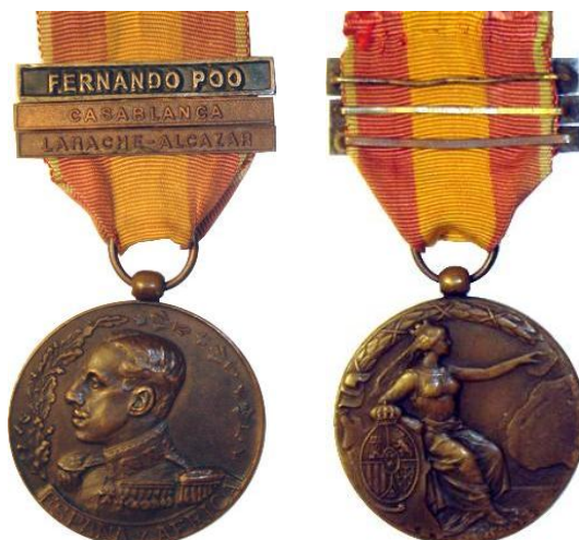
Fig. 6. Modelo D8 Colección JMGC Anilla redonda. Pasadores LARACHE-ALCÁZAR, CASABLANCA y FERNANDO POO