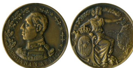
Fig. 16. Modelo D4 Colección Carlos Lozano Liarte