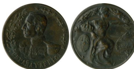
Fig. 14. Modelo D2 Colección Carlos Lozano Liarte