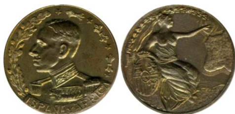
Fig. 21. Modelo D9 Colección Carlos Lozano Liarte