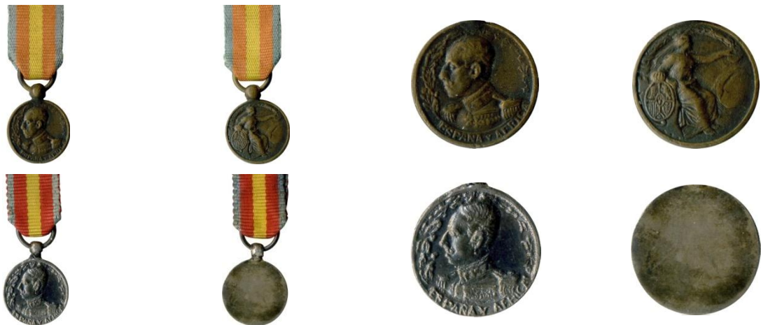
Fig. 24. Miniaturas de la Medalla de África - Colección Carlos Lozano Liarte