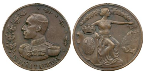
Fig. 9. Modelo Castells Colección Carlos Lozano Liarte