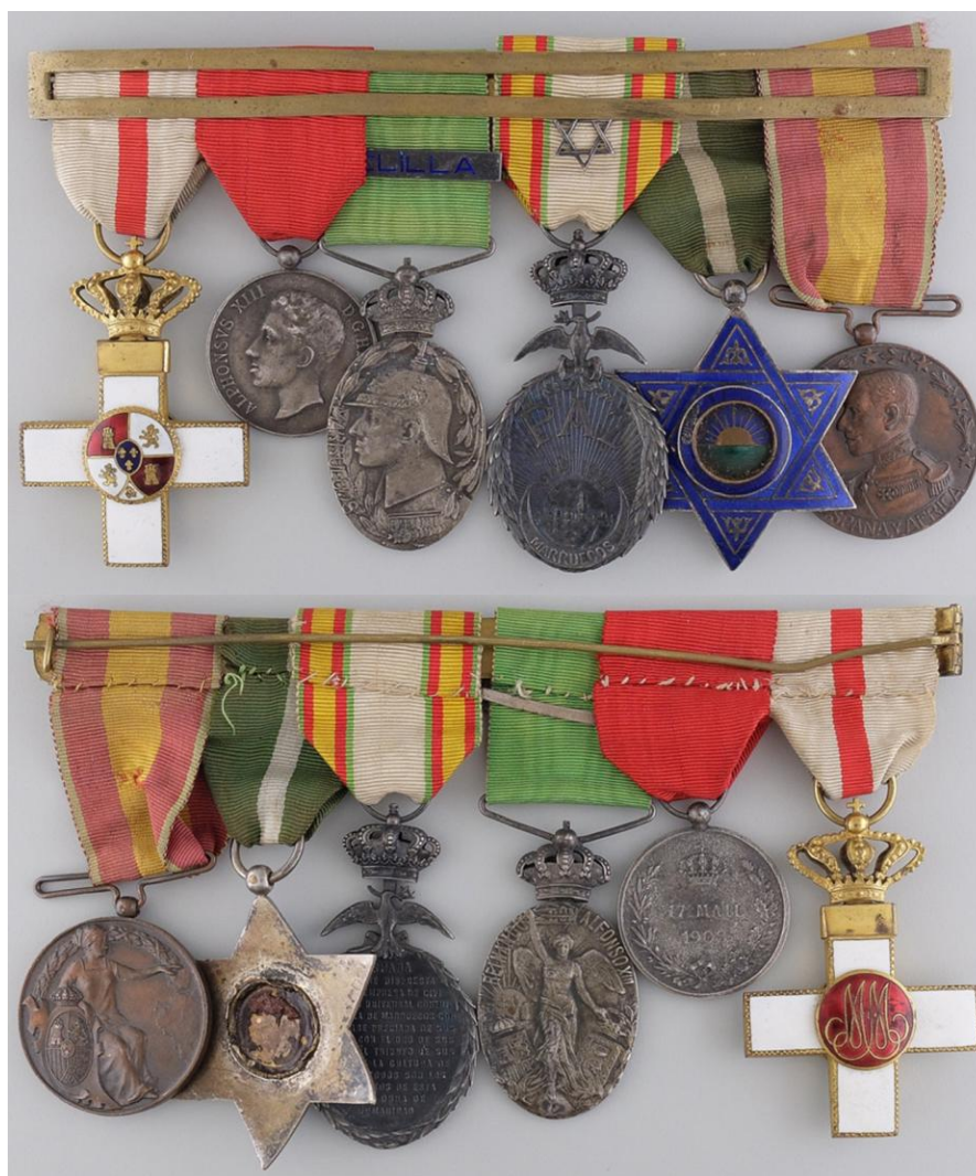
Fig. 28. Anverso y reverso de un pasador con seis condecoraciones: Cruz de 1ª clase de la Orden del Mérito Militar con distintivo blanco, Medalla de la proclamación de Alfonso XIII, Medalla militar de Marruecos con pasador MELILLA, Medalla de la Paz de Marruecos, Cruz de Caballero de la Orden Mehdauiya y Medalla de África (modelo D1) –sin pasador y con asa oblonga.