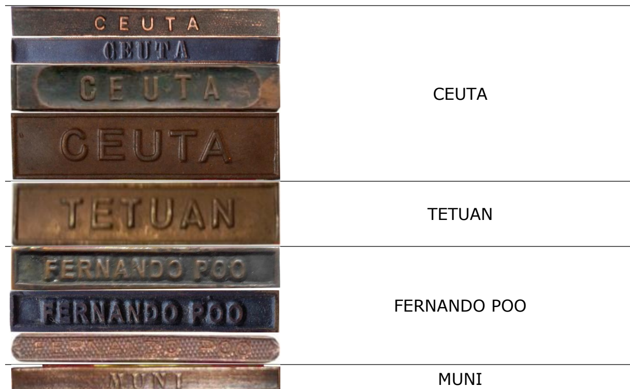
Fig. 26. Pasadores - Varias colecciones