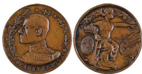
Fig. 19. Modelo D7 Colección particular