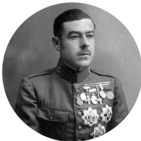
Fig. 30. Comandante de Infantería Alfredo Coronel Cubria. En el pasador lleva las siguientes condecoraciones: Medalla de la campaña de Filipinas, Medalla de la proclamación de Alfonso XIII, Cruz de 1ª clase de la Orden del Mérito Militar con distintivo rojo, pensionada, con dos pasadores de repetición, Medalla de Melilla con dos pasadores, Cruz de 1ª clase de la Orden del Mérito Militar con distintivo rojo, Medalla conmemorativa del centenario de los hechos de armas del Bruch y la Medalla de África, sin pasador. En el pecho dos Cruces de 2ª clase de la Orden del Mérito Militar con distintivo rojo, una de ellas pensionada (dos concesiones) y la Cruz de 1ª clase de la Orden militar de María Cristina.

Biblioteca Virtual de Defensa. j_mmue_120838_00001