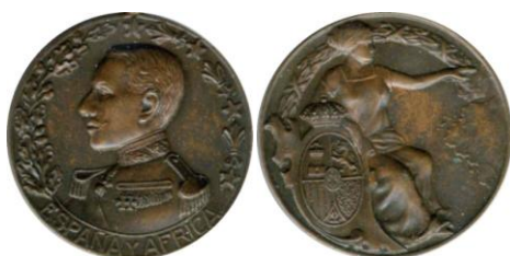
Fig. 13. Modelo D1 Colección Carlos Lozano Liarte