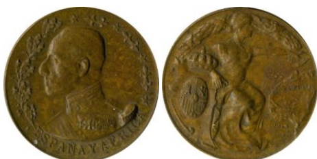
Fig. 15. Modelo D3 Colección Carlos Lozano Liarte