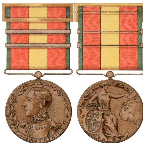
Fig. 1. Medalla de África - Colección Legislativa

En diciembre de 1913, el gobernador de Guinea remitió a la Dirección General de Marruecos y Colonias, para su pase al Ministerio de la Guerra, un listado de personal militar y civil propuesto para la concesión de la medalla, por llevar más de dos años de servicio en la colonia. En ella se encontraban, sobre todo, oficiales y marinería de los buques de la Armada estacionados en Guinea, personal europeo de la Guardia Colonial, funcionarios civiles, y misioneros y religiosas concepcionistas 10 .