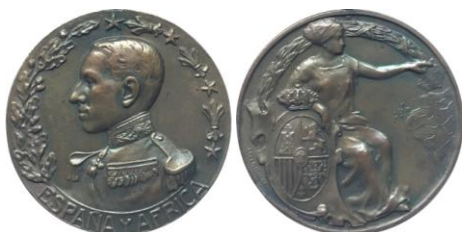
Fig. 11. Modelo Vallmitjana Colección J. Cantos - L. Carrobles