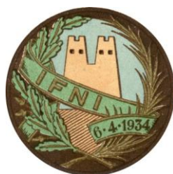
Fig. 8. Distintivo de la ocupación de Ifni 35 , Colección Legislativa