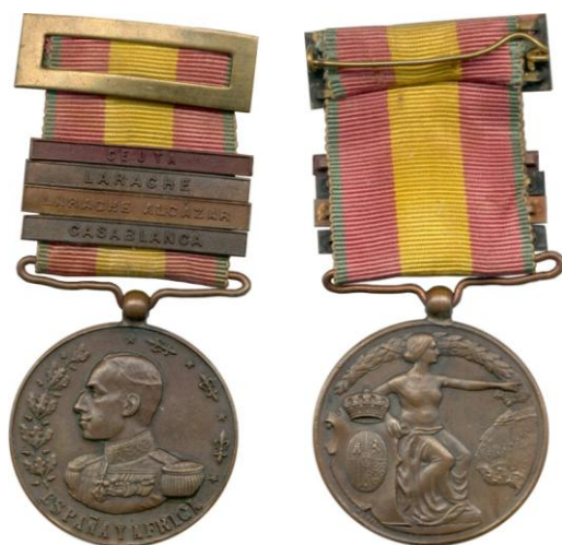
Fig. 2. Modelo Castells Colección Carlos Lozano Liarte Asa oblonga. Pasadores CASABLANCA, LARACHE ALCÁZAR, LARACHE y CEUTA

Modelo D10. Ejemplar de 35 milímetros de diámetro con el anverso ya descrito y la leyenda separada del busto por una línea, siendo los detalles y relieve escasos. En el reverso, lleva los relieves y no incluye las islas Canarias ni leyendas. Una pequeña corona va separada del escudo. La matrona lleva corona mural y son visibles ambos pies, que se apoyan en un suelo (Figuras 7, 22 y 29).