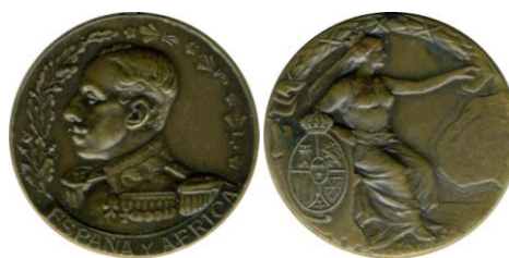
Fig. 20. Modelo D8 Colección Carlos Lozano Liarte