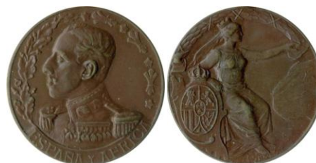
Fig. 22. Modelo D10 Colección Carlos Lozano Liarte