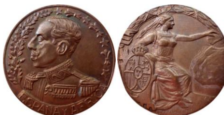
Fig. 12. Modelo RC Colección Antonio J. Bujalance Jiménez