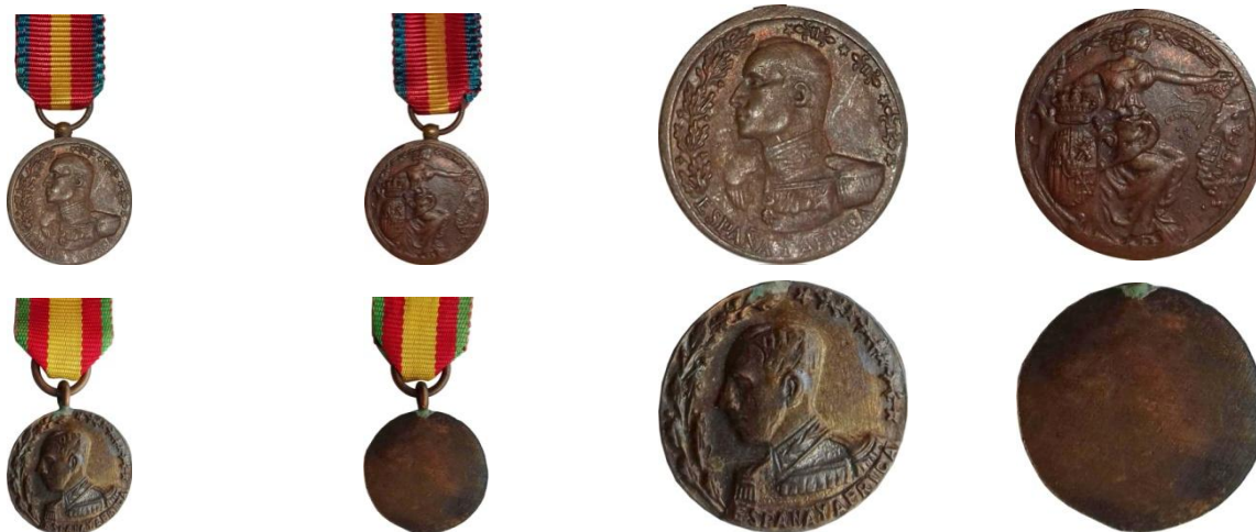
Fig. 23. Miniaturas de la Medalla de África - Colección EMF

Uno de los ejemplares cuyo diámetro es de 15,3 milímetros, lleva en el anverso el busto del rey mirando a la derecha con la inscripción y detalles grabados en vez de en relieve. El reverso es liso (Figura 25).