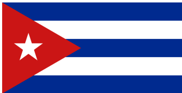
Fig. 2.- La bandera cubana

Las formas finales de ambos símbolos patrios, la bandera y el escudo, fueron fijadas en 1906 por el primer Presidente de la República, Tomás Estrada Palma. Por cierto, otro masón. Y dado que tanto Narciso López como Teurbe Tolón eran también destacados masones, las insignias creadas por ellos tienen un acentuado carácter masónico.