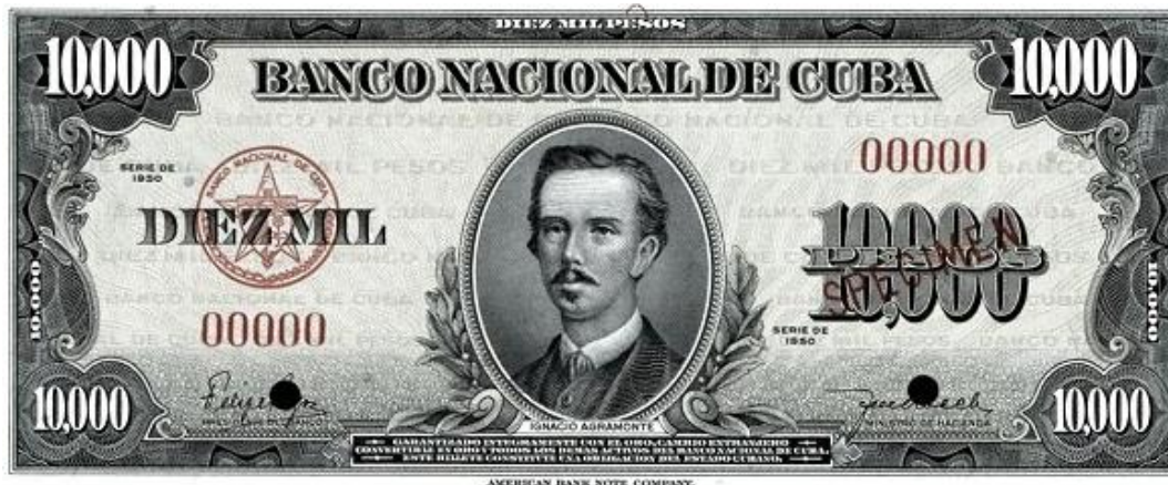
Fig.7.- Anverso de un billete cubano de 10,000 pesos de 1950

De hecho la lista sería considerablemente más corta si enumerásemos a aquellos personaje no masones que están o han estado presentes hasta la fecha actual en las monedas y billetes cubanos circulantes. Esta lista quedaría conformada únicamente por los Comandantes Camilo Cienfuegos y Ernesto Guevara, el líder revolucionario Frank País y el cofundador del Partido Comunista Julio Antonio Mella.