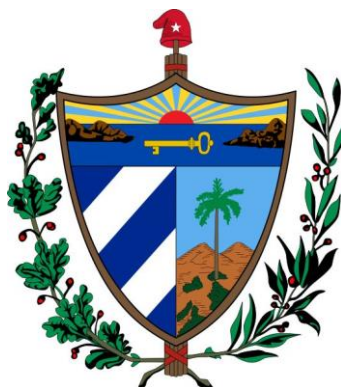
Fig. 3.- Escudo oficial de Cuba, versión aprobada en 1906 y basada en aquel adoptado por la Asamblea Constituyente de Guáimaro en 1869

Del escudo podemos hacer mención a la presencia del gorro frigio. Este símbolo republicano se popularizó durante la revolución francesa y fue adoptado desde entonces por los masones como símbolo de la libertad. En el caso del escudo cubano, dicho gorro lleva inserta la ya comentada estrella de cinco puntas. No obstante, algunos estudiosos han cuestionado que estos elementos estuviesen presentes en la versión del escudo originalmente concebida por Teurbe. En todo caso, la versión del escudo actual, es decir incluyendo el gorro frigio y la estrella, no difiere apenas de aquella aprobada en la Asamblea de Guáimaro, que como vimos tuvo una abundante representación masónica.