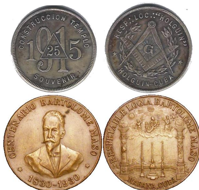
Fig. 8.- Fichas emitidas por logias cubanas

Las distintas sociedades y logias establecidas en Cuba han producido a lo largo del tiempo fichas de variados tipos con índole conmemorativo. Las mismas reproducen una gran cantidad de otros símbolos masónicos que no han sido comentados con anterioridad. Entre ellos podemos citar, a modo de ejemplo, la escuadra y el compás, que pueden representar la dualidad entre el mundo terrenal y el espiritual; La letra “G” que alude, entre otros significados, al Gran Arquitecto del Universo (GADU) y que es a menudo representada en la parte central del símbolo formado por la escuadra y el compás. Finalmente, las columnas masónicas hacen alusión a los dos pilares del pórtico del Templo del Rey Salomón