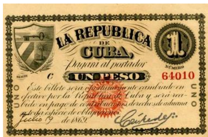
Fig. 5.- Anverso de un billete de un peso emitido en 1869 por la República de Cuba en Armas con la firma de Céspedes

El Primer Presidente de la República de Cuba en Armas, Carlos Manuel de Céspedes, estampó su firma en muchos de los billetes emitidos en 1869. Como vimos anteriormente, Céspedes que también era Venerable Maestro en una logia masónica, no tuvo reparos en añadir los referidos tres puntos detrás de su firma. Esto evidencia su convicción en la compatibilidad de los principios masónicos con la guerra de independencia librada en aquellos momentos.