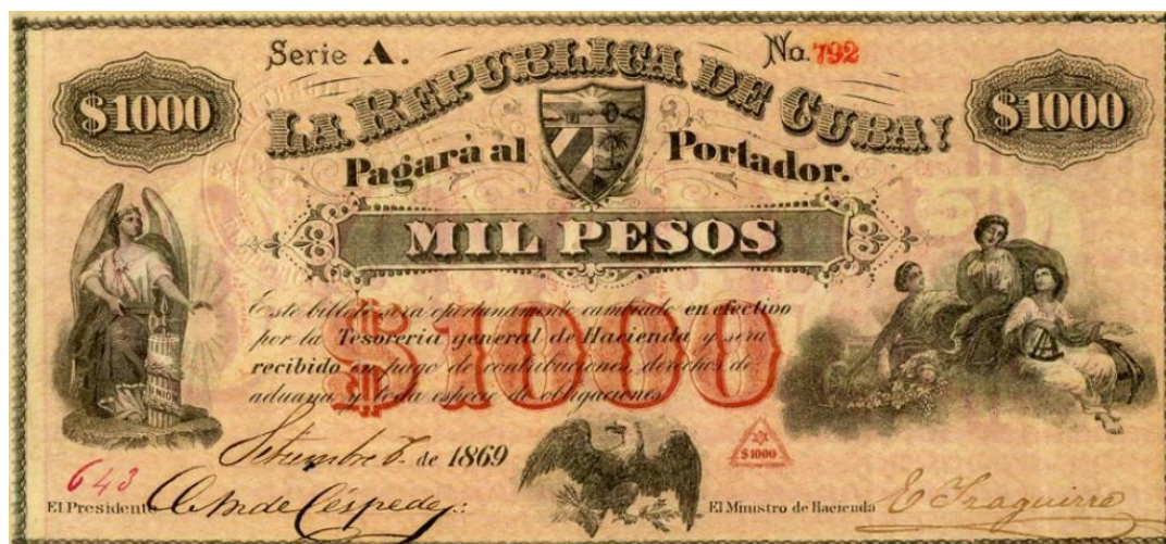
Fig. 6.- Anverso de un billete de mil pesos emitido en 1869 por la República de Cuba en Armas con las firmas de Céspedes e Izaguirre

La abundancia de referencias masónicas queda plenamente ilustrada en los billetes de 500 y 1000 pesos emitidos en 1869 por la República de Cuba en Armas. Los mismos llevan estampada la firma de Céspedes seguida de los ya comentados tres puntos, exhiben un triángulo equilátero rojo con una estrella de seis puntas en su interior (debajo del último cero de la denominación) y fueron firmados además por el también masón Eligio Izaguirre en calidad de Ministro de Hacienda.