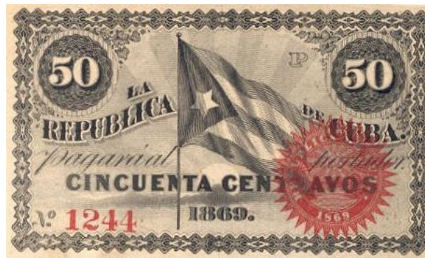
Fig. 4.- Anverso de un billete de 50 centavos emitido en 1869 por la República de Cuba en Armas

El escudo oficial está lógicamente presente en la mayoría de billetes y monedas cubanas constituyendo así un testimonio de las ideas masónicas que imbuyeron a los próceres independentistas cubanos. Algunas piezas, aunque significativamente menos, muestran la bandera cubana.