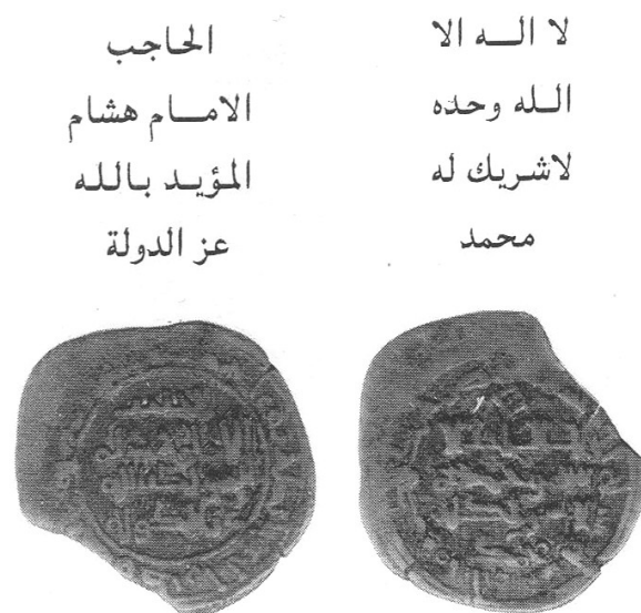
Fig. 2. Dirham de 'Izz al-Dawla con fecha 446H.