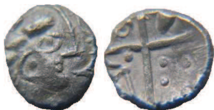
Fig. 13 : Collection privée - Prov. Inconnue ; 0,4g ; 8 mm.

Nous présentons ici une monnaie rare (n°12, Revue numismatique de 1839) qui se distingue des précédentes par une tête à droite. Au revers, une croix bouletée formant quatre cantons. Le premier contient une ellipse, le deuxième contient une balle de fronde. Le troisième contient une hache évidée avec un manche bouleté. Enfin, le quatrième contient trois points formant un triangle. Des lunules sont disposées aux extrémités des quatre cantons.