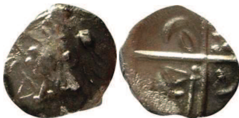
Fig. 9 : Collection privée - Prov. : Pignan (Hérault) ; 0,39 g ; 9 mm

Le revers est constitué d'une croix bouletée avec au premier canton une ellipse, au second, trois points formant un triangle, au troisième, une hache évidée avec un manche bouleté et au quatrième une balle de fronde. Des lunules sont disposées aux extrémités des quatre cantons. Il est important de préciser qu'un seul exemplaire est connu pour ce revers. Il provient de Pignan (Hérault) (CL-094).