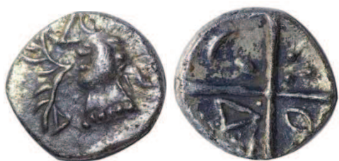
Fig. 10 : Collection privée - Prov. (Hérault) ; 0,37 g ; 5 mm

Le revers est constitué d'une croix bouletée avec au premier canton une ellipse, au second, trois points formant un triangle, au troisième, une hache évidée avec un manche bouleté et au quatrième une balle de fronde. Des lunules sont disposées aux extrémités des quatre cantons. Il est important de préciser qu'un seul exemplaire est connu pour ce revers. Il provient de Pignan (Hérault) (CL-094).