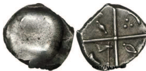
Fig. 16 Drachme de style hybride entre “cubiste et romanisé” - Ref : CGB

hybride entre “cubiste et romanisé” (cf. Fig. 16). Espérons que les futures recherches permettront d’affiner les connaissances liées à l’obole de Grabels qui demeure encore aujourd’hui lacunaires.