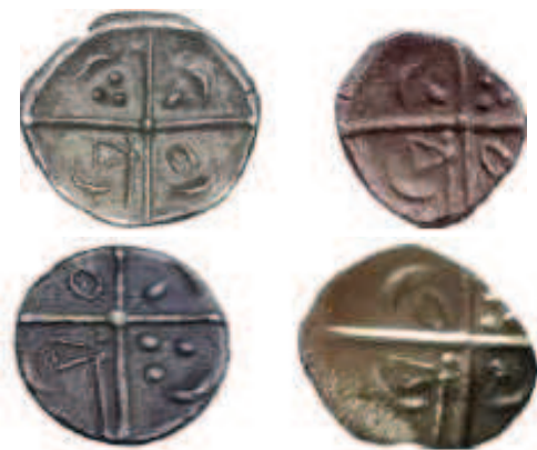
Fig. 5 : Revers connus pour l'obole de Grabels.

Au revers, les branches de la croix délimitent quatre cantons, tous ornés d'une lunule (souvent hors flan). Sous chaque lunule, quatre motifs peuvent être représentés selon un ordre différent : hache, ellipse, balle de fronde, trois points. Il existe différentes variantes de revers de l'obole de Grabels (cf. Fig. 5). Seule la hache reste dans le troisième canton. Dans (Lopez 2001), l'auteur s'interroge sur l'éventuelle signification du placement de ces motifs : est-il le fruit du hasard ou bien est-il bien pensé ? Ne pourrait-on pas penser que le placement des motifs permettait de marquer l'émission monétaire, de la même façon que pour le placement des points secrets à l'époque médiévale ? Espérons que les futures recherches permettront de répondre à ces questions.