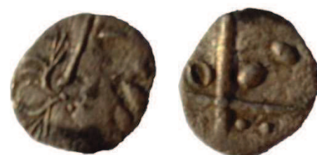
Fig. 7 : Collection privée - Prov. Saint Saturnin de Lucian (Hérault) ; 0,30g ; 9 mm

Le type LATO 102 est caractérisé par un revers présentant deux balles de fronde dans le second canton. Notons que cette caractéristique peut être l'objet d'un coin défectueux (coin bouché ?) ou d'une dégénérescence de la lunule qui se situe habituellement au-dessus de chaque canton.