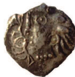
Fig. 2 : Coll. Privée. Prov. Hérault ; 11mm ; 0.45 g

Nous présentons les différents avers d'obole de Grabels que nous avons rencontrés (cf. Fig. 2, 3 et 4).