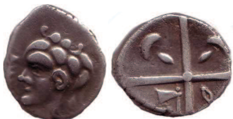
Fig. 1 Drachme cubiste (série lourde) ; Wikimoneda n° 1489

À partir de la fin de la fin du III ème siècle avant J.-C., de nombreuses frappes viennent étoffer le monnayage de la Gaule du Sud, jusqu'alors sous influence massaliète et ibérique. Les échanges commerciaux vont alors s'intensifier et les peuplades protohistoriques vont s'adapter à ce nouveau moyen d'échange. Généralement, l'avvers de ces monnaies présente un profil et au revers une croix cantonnée de divers motifs (cf. Figure 1).