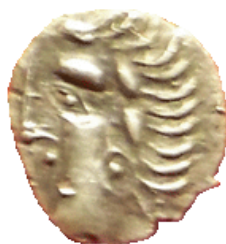
Fig. 4 : Coll. Privée. Prov. Hérault ;

Au revers, les branches de la croix délimitent quatre cantons, tous ornés d'une lunule (souvent hors flan). Sous chaque lunule, quatre motifs peuvent être représentés selon un ordre différent : hache, ellipse, balle de fronde, trois points. Il existe différentes variantes de revers de l'obole de Grabels (cf. Fig. 5). Seule la hache reste dans le troisième canton. Dans (Lopez 2001), l'auteur s'interroge sur l'éventuelle signification du placement de ces motifs : est-il le fruit du hasard ou bien est-il bien pensé ? Ne pourrait-on pas penser que le placement des motifs permettait de marquer l'émission monétaire, de la même façon que pour le placement des points secrets à l'époque médiévale ? Espérons que les futures recherches permettront de répondre à ces questions.