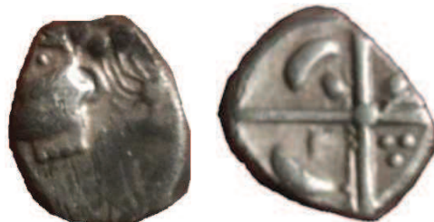
Fig. 11 : Collection privée - Prov. (Hérault) ; 0,54g ; 9 mm

Le revers est constitué d'une croix bouletée avec au premier une balle de fronde, au second, trois points formant un triangle, au troisième, une hache évidée avec un manche bouleté et au quatrième une ellipse. Des lunules sont disposées aux extrémités des quatre cantons. Ref : CL-092, OCR-265.