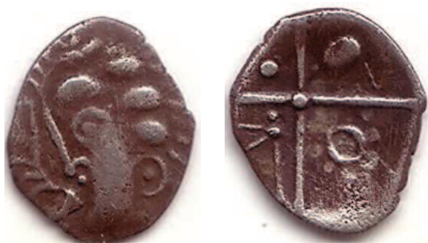
Fig. 8 : Collection privée - Prov. Hérault ; 0,37 g ; 5 mm

Le revers est constitué d'une croix bouletée avec au premier canton trois points formant un triangle, au deuxième canton une balle de fronde, au troisième, une hache évidée avec son manche bouleté et au quatrième une ellipse. Des lunules sont disposées aux extrémités de quatre cantons mais sont ici hors champs.