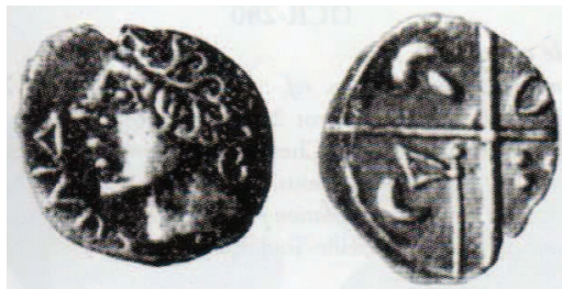
Fig. 12 : OCR-261 (Feugère et Py 2011) - Prov. Sextantio (Castelnau-le-Lez, Hérault) ; 0,40g ; 6-10mm

Ce type de revers est apparié à celui des oboles dites au DIVOS (Colbert de Baulieu, 1998).