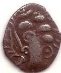
Fig. 3 : Coll. Privée. Prov. Hérault ; 5mm ; 0.37 g (Wikimoneda n° 1705 )