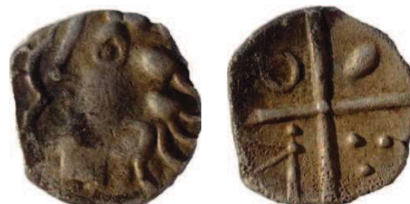
Fig. 6 : Obole de Grabels LATO 101) Prov. Pignan (Hérault) ; 0,45g ; 10 mm

Ce type de revers se caractérise par une croix bouletée formant quatre cantons. Le premier canton contient une ellipse, ou bien un cercle. Le deuxième contient une balle de fronde appelée aussi ogive. Le troisième contient une hache évidée avec un manche bouleté à son extrémité. Enfin, le quatrième contient trois points en triangle. Des lunules sont disposées aux extrémités des quatre cantons et sont souvent hors champs.