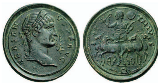
Figura 1: Contorniato regular d.= 38 mm. Æ 28,45 gr. A/ TRAIAN-VS PF AVG busto laureado de Trajano a la derecha. En campo, monograma con forma de palma. R/ E - VT - YMIVS Auriga en cuadriga con palma- y riendas en sus manos. en exergo, corona entre dos ramas de palma. NAC, Auction 29, lote 673 (Alföldi 1976 y 1990:274, 6 y lám. 115, 6). 3

Los motivos representados son muy variados y no parece haber una conexión temática clara entre el anverso y reverso de cada pieza, por lo menos no una reconocible hoy en día. De hecho, los cuños se utilizan en numerosas combinaciones, lo que permite reconstruir grandes series que son el principal medio para establecer secuencias cronológicas internas de los contorniatos. A partir de las conexiones de cuños pueden identificarse tres grupos diferentes que presentan numerosas ligazones hacia el interior de cada uno de ellos, pero no entre sí: