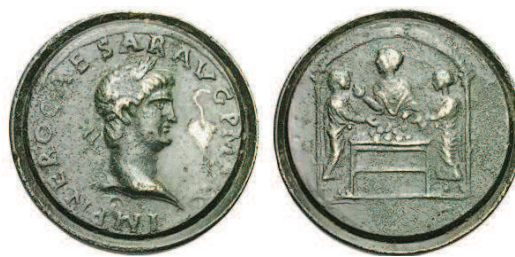
Figura 5 – Contorniato regular – d.=39mm. Oricolco 26,18 gr. Anv.: IMP NERO CAESAR AVG P MAX busto laureado hacia la derecha, en campo monograma con forma de hoja de hiedra relleno de plata. Rev.: Tres personas junto a una mesa con contorniatos(?). La figura de la derecha es aparentemente femenina. Arriba y a los costados se reconoce el arco y las columnas de lo que podría ser una pequeña tienda. Gemini, Auction V, lote 854. 25

En una discusión de la propaganda senatorial en el Bajo Imperio, el gran historiador italiano Santo Mazzarino cuestionó la interpretación de los contorniatos como medios de difusión de ideas anticristianas, viendo en ellos, más bien, una intención de homenajear a la ciudad de Roma en su totalidad 26 . Mazzarino trató en más detalle sobre los contorniatos en un artículo de la Enciclopedia dell' Arte Antica aparecida en 1959 y, modificando aparentemente sus concepciones, considera, a partir de evidencia epigráfica, que los mismos habrían representado una pecunia spectaculis de carácter especial, distribuida a aquellos ciudadanos con derecho a participar de las distribuciones gratuitas de pan de la capital 27 .