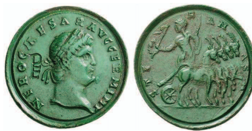
Figura 3: Contorniato regular con monograma PE. d.= 41 mm. Æ 18,01 gr. A/ NERO CAESAR AVG GERM IMP cabeza laureada a la derecha; en el campo, monograma PE grabado. R/ STE - F - AN -. Auriga en quadriga hacia la derecha y mirando hacia atrás, sosteniendo corona y látigo en la mano derecha y con palma en la izquierda. (Alföldi y Alföldi 1976 y 1990:59, 192,12 y lám. 71, 8). 7

Otro rasgo frecuente –que ha intrigado especialmente a los estudiosos- es el hecho de que en las caras de muchos contorniatos encontramos grabados diversos monogramas, siendo, los más frecuentes, dibujos con forma de palma y una combinación de las letras P y E. Estos símbolos fueron añadidos a las piezas terminadas y su estilo demuestra que algunos de ellos provienen de la mano de artesanos profesionales y otros son el producto de personas inexpertas. Su significado no es claro 6 .