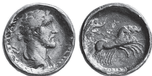
Figura 2: Proto-contorniato. d.= 30 mm. Æ 23,93 gr. Originalmente un sestercio de Antonino Pío de 140-144 d.C. A/ ANTONINVS AVG - PIVS PP COS III Busto ala derecha. R/ VICTORIA AVG / SC Victoria en quadriga: RIC 113, 654, 212 BMC, 1328. The New York Sale, Auction 5, lote 308. 5

estos cuños de reverso con uno perteneciente al grupo de los contorniatos regulares -que dentro de la serie cronológica correspondería al 400 d.C.- permite una datación aproximada de la serie en esa fecha 4 .