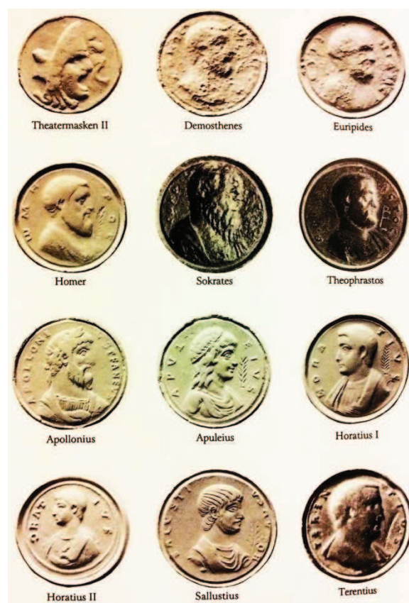
Figura 4 – Cuños de contorniatos regulares con imágenes de escritores e intelectuales (extraído de Mittag 1999: lám. 4)

Los resultados de las investigaciones tempranas fueron sistematizados por el padre de la numismática científica, Joseph Eckhel, a fines del siglo XVIII, quien estableció en forma definitiva la datación bajoimperial de este tipo de piezas y su carácter pseudo-monetario.