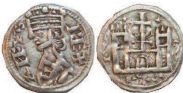
Dinero de Alfonso VIII (1158-1214) ¿Toledo? A/ Busto tocado con capiello a izda, ANFVS REX, R/ Castillo con cruz central adornada con estrellas a ambos lados; CASTELE.

Es por tanto interesante de analizar el tocado de la corona, atributo del que hablaremos en los siguientes párrafos y que inequívocamente es el modelo de corona imperial.