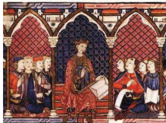
Detalle de Imagen del General Estoria, fechado en 1280. Cuatro intercolumnarios albergan a Alfonso X y sus colaboradores, clérigos, caballeros y escribas

establece quienes podían vestir y quienes no ciertas prendas del citado color.