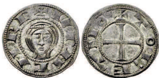
Dinero de Urraca (1109-1126). Toledo. A/ +VRACA RE. R/ +TOLETVO. III-11. EBV-. Muy rara en esta conservación. Ex HSA-8815