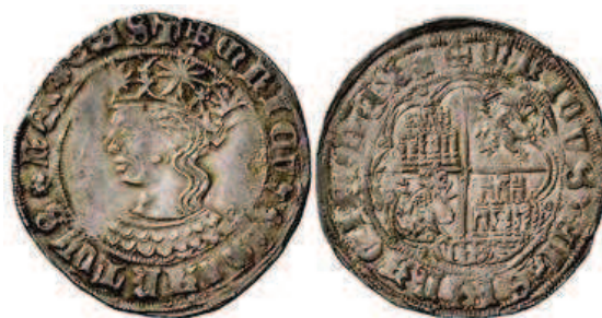
Real de Enrique IV (1454-1474), ceca Segovia, A/ ENRICVS QARTVS REX CAST alrededor de un busto coronado dentro de una orla circular, R/ ENRICVS DEI GRATIA REX CAS alrededor de un cuartelado de castillos y leones con acueducto (ceca) debajo, dentro de una orla lobular.

Por último es de justicia citar que la corona con terminaciones en florones está muy ligada al linaje de la monarquía aragonesa y su tallado se puede ver frecuentemente en las acuñaciones de dineros de Pedro II (1196-1213), Jaime I (1213-1276) y Jaime II (1291-1327) 7 .