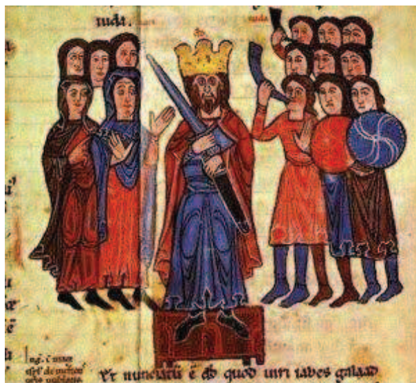
Ilustración de la Coronación de Alfonso VII.

Como muchos de los lectores conocerán, el primer retrato regio que aparece en la numaria castellano y leonesa es el de la reina Urraca (1109-1126), plasmándose una simple caput o cabeza frontal de claros rasgos románicos. En este caso la reina está ataviada con un tocado de velo con cinta, del que ya se hace referencia como prenda común en el vestir de la mujer en el Código Emilianense (hacia el año 992) 2 .