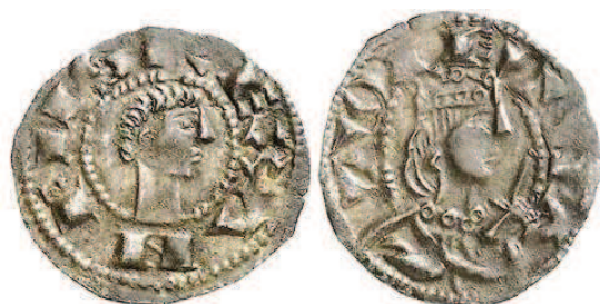
Óbolo de Alfonso VIII (1158-1214). Toledo. A/ Busto a derecha NFVS REX. R/ Busto coronado a derecha con globo y espada. TOLETV.

enunciado, la corona imperial, con la que Alfonso VII se hizo representar 5 , otra la de un dinero toledano de tiempos de Alfonso VI denominado “de busto godo”. En el se muestra la cabeza ceñida por una especie de un aro más o menos ensanchado remarcado por perlas del que parten longitudinalmente varias hileras adornadas del mismo modo que se unen en la parte superior. El origen de este tipo de corona, que más bien sería diadema hay que buscarlo históricamente en el antiguo Imperio Romano de Oriente.