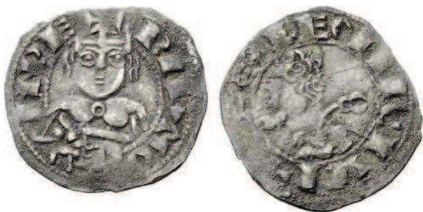
Óbolo atribuido a ALFONSO VII. León. A/ IMPERATO. R/ LEONI CIVIT-S. III-no. MBC+/MBC.

forrada de piel de conejo, armiño, lirón, etc. Se complementaba con ricos bordados y cenefas.