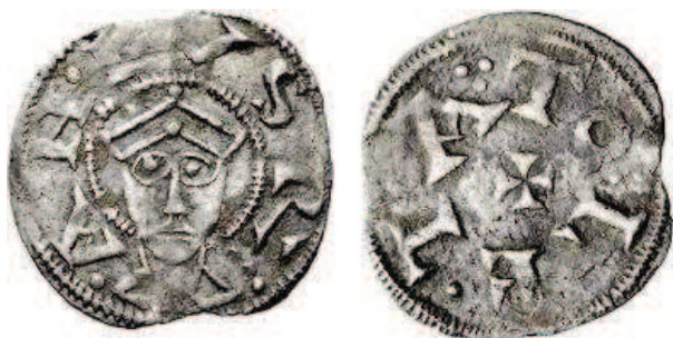
Dinero de Alfonso VI. Toledo. A/ Busto coronado de frente alrededor, ley.: •AN •FVS R'V. R/ TO•LE•TA. Ex HSA•28306.

En el periodo histórico que va desde Alfonso VI (1072-1109) hasta Enrique IV (1454-1474) el diseño numismático más representado es el de la corona real abierta flordelisada, que consiste en un aro de oro enriquecido con piedras preciosas, realzado de ocho florones, interpolados con ocho puntas rematadas en flor de lis 4 . El diseño es similar también al de la corona de infante, esta última reservada para hijos de reyes o príncipes. El origen de esta corona data de tiempos de Fernando I de León (1038-1065).