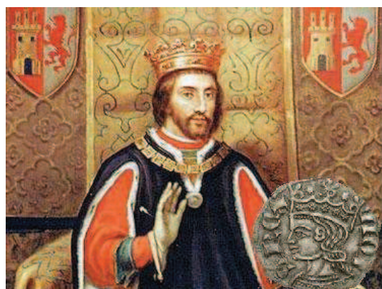
Representación de Alfonso XI a través de una pintura y un cornado

Con Sancho IV (1284-1295) y Alfonso XI (1312-1350), ya en pleno gótico, se comenzarán a advertir diferencias notables en el arte de las tallas elaboradas por las distintas cecas, siendo unas más austeras y otras más profusas en detalles del labrado. Esta diferencia es debida al diferente calado que según las poblaciones fue adquiriendo el movimiento artístico del gótico y también, que duda cabe a la capacidad del propio entallador o grabador 3 .