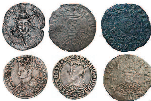
Anversos de cuartillos y reales donde se aprecian diferentes vestidos de Enrique IV.

Los testimonios numismáticos del Impotente nos reflejan una variada muestra sayas y jubones que debieron ser prendas predilectas del monarca. He aquí algunos ejemplos en maravedís y cuartillos.