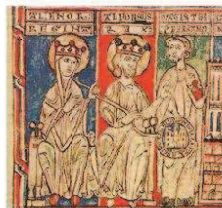
Ilustración de códice del monarca y su esposa Leonor