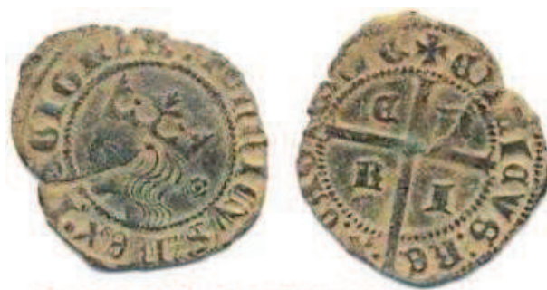
Cruzado de Enrique II, marca Floron

En el periodo histórico que va desde Alfonso VI (1072-1109) hasta Enrique IV (1454-1474) el diseño numismático más representado es el de la corona real abierta flordelisada, que consiste en un aro de oro enriquecido con piedras preciosas, realzado de ocho florones, interpolados con ocho puntas rematadas en flor de lis 4 . El diseño es similar también al de la corona de infante, esta última reservada para hijos de reyes o príncipes. El origen de esta corona data de tiempos de Fernando I de León (1038-1065).