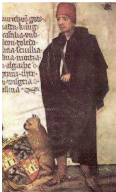
Enrique IV de Castilla (miniatura de un manuscrito del viajero alemán Jörg von Egingen, circa 1455)

En otros textos de la época hay pocas menciones a joyas, collares, sedas u otros objetos ostentosos. Pero Enrique IV vistió, o al menos pudo hacerlo, con toda dignidad y abundancia, de modo que si el “ extremado descuido en el vestir ” al que alude Palencia fue cierto alguna vez, lo sería por voluntad del rey pero no por escasez de medios a su disposición en la Cámara, como así se refleja en los documentos de cuenta 9 .