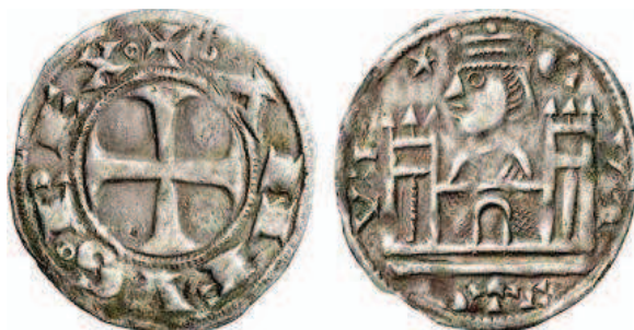
Dinero de Alfonso VIII (1158-1214) de la subasta Künker 137 (2008)

capiello hace referencia a toda prenda que se llevara en la cabeza. El capiello, representado en la moneda, es de tocado alto y con terminaciones en florones. También la corona guardará el mismo aspecto cilíndrico y la terminación de los mencionados florones.