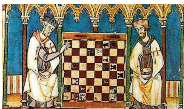
Partida de ajedrez, representación del Libro de los Juegos de Alfonso X el Sabio

Como se aprecia en la siguiente ilustración del Libro de juegos de Alfonso X El Sabio , los capiellos de los personajes recuerdan, por su forma, a ese casco-corona cilíndrico que hemos visto representado en el anteriormente. Fue un tocado que se puso muy de moda y el preferido