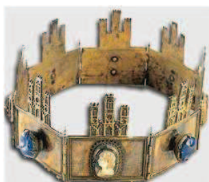
Corona de camafeos, de latón fundido y dorado y pedrería engastada. 55 cm (extendida) x4'5 cm. Ubicada en el Cabildo Catedral Primada de Toledo

En cuanto a la referencia documental; parece ser que existía otro tipo de corona utilizada por la monarquía castellana cuya alusión sería a la antigüedad y que estaría vinculada al reino y su transmisión. En definitiva, vendría a incidir en la idea de un linaje elegido y protegido por la