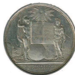
Fig. 9: Reverso de la medalla celebrando la promulgación de la Constitución de 1812. En el emblema de las Cortes de Cádiz, España (o Marte, según versiones) y las Indias se dan la mano, bajo el "astro brillante". Colección del autor.

El Sol, ya sea el incaico o el de Borbón, ya no es la esperanza de un nuevo amanecer, sino la realidad de un nuevo día; por eso se lo excluye del “sello”, y se lo pone completo, como figura de máxima jerarquía, representación de la soberanía en sí misma y, por lo tanto, de mayor importancia que ningún “sello” provincial. En el anverso, claro está.