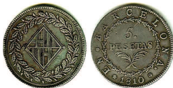
Fig. 2: 5 pesetas de Barcelona 1810, acuñadas entre 1808 y 1814. Colección del autor.

Barcelona”; retenga el lector en su memoria esta breve palabra, “en”, poco habitual expresión en numismática, sobre la que se retornará al hablar de las potosinas autónomas.