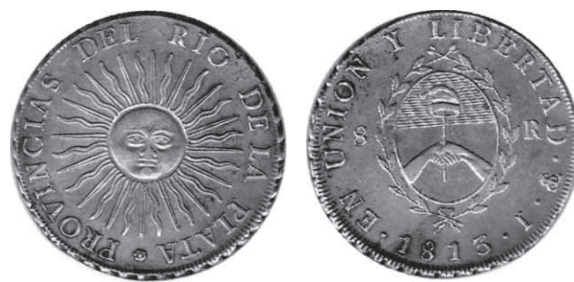
Fig. 4: Ocho Reales potosinos de 1813. Acuñación autónoma rioplatense. Colección del autor.

“...La moneda de plata que de aquí en adelante debe acuñarse en la Casa de Moneda de Potosí, tendrá por una parte el sello de la Asamblea General, quitado el Sol que lo encabeza; y un letrero que diga alrededor: Provincias del Río de la Plata; por el reverso un Sol que ocupe todo el centro, y alrededor la inscripción siguiente: En Unión y Libertad; debiendo además llevar todos los otros signos que expresen el nombre de los ensayadores, lugar de la amonedación, año y valor de la moneda y demás que han contenido las expresadas monedas ” (subrayado del autor). Claramente, el “reverso” está tomado como el “revés”, el “otro lado” del que describe en primer término, por considerarlo tal vez, solo tal vez, de mayor importancia, pero al que no llama “anverso”, al igual que Ezpeleta a la barcelonesa. El Sol fue desalojado de su lugar en el “sello”, pero no porque no fuera importante, sino para darle un lugar mas destacado en la moneda.