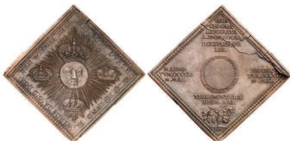
Fig. 5: Acuñaciones durante la Guerra de Sucesión. Barcelona liberata: El Rey Sol, centro del universo, a cuyo alrededor giran las coronas de Europa...y el Sol eclipsado, sobre flores de lis marchitas

Mínguez ha tenido solamente en cuenta lo acontecido en la Nueva España, sobre todo en México; y apenas ha mencionado a las medallas. De ellas, tan solo las juras reales, destacando como su período de esplendor la última parte del siglo XVIII y los primeros años del XIX: No registra para nada las medallas europeas de la Guerra de Sucesión.