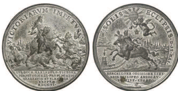
Fig. 6: Acuñaciones durante la Guerra de Sucesión. Solis eclipsis : Mientras John Churchill, duque de Marlborough, mas conocido luego como Mambrú, cabalga victorioso, Felipe huye de Barcelona. Lo hace en medio del eclipse que provoca un ángel, tapando el Sol con las armas de Austria