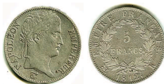
Fig. 3: cinco francos de Napoleón I. Moneda francesa, del tipo de las acuñadas, con ligeras variantes, entre 1806 y 1815. Similares reversos se usaron desde las primeras acuñaciones de la revolución, y habría inspirado el reverso de las acuñaciones barcelonesas, entre 1808 y 1814. Colección del autor.

Parece claro que, aunque no lo mencione explícitamente, considera como mas importante o “anverso” a la cara de la moneda en que aparezca el escudo de Barcelona, en tanto que si menciona al “reverso”;