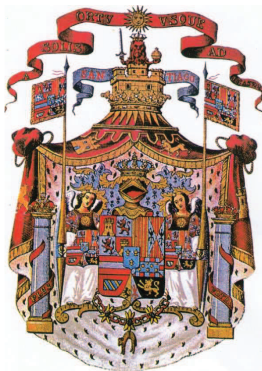
Fig. 7: Escudo "grande" de Felipe V. con ligeras modificaciones, se usó hasta Fernando VII.

Uno de los tantos cambios introducidos por el primer Borbón que reinó en España, con el nombre de Felipe V, fue la introducción de un elaborado escudo, en el que figuraban todos sus dominios, reales o pretendidos, flanqueado por dos tenantes, especie de ángeles, que en la parte delantera de sus vestimentas lucían un Sol radiante, representado siempre con mas de los 16 rayos heráldico (generalmente, 32) y, como pieza de mayor jerarquía, surmontando el todo, el Sol sobre una cartela de gules, con la leyenda: “A solis ortu usque ad occassum”, tomado del salmo de Asaf 49, en referencia a extenderse de un extremo al otro de la Tierra los dominio de la Corona 18 . Lo que viene a poner el punto final al por qué de tal proliferación de soles, de la que se hizo hasta aquí apretada síntesis