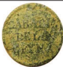
09.02.02b Variante Reina de Línea. Caballería 1800-1804