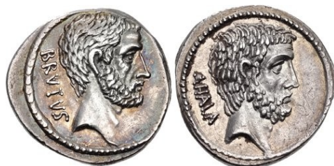
Denario RRC 433/2 de Bruto el tiranicida

Crawford fecha esta emisión en el año 54 a.C. 12 , pero hay fechas alternativas, como ca. el año 60 a.C. 13 , ca. el año 59 a.C. 14 , el año 59 a.C. 15 , ca. el año 58 a.C. 16 , el año 58 a.C. 17 , el año 57 a.C. 18 , ca. el año 55 a.C. 19 o incluso en el año 53 a.C. 20 Otros autores no se pronuncian, y dan diferentes fechas aportadas por otros estudiosos 21 . Sea como fuere, parece evidente que esta amonedación fue realizada en los convulsos años de la década de los años cincuenta del s. I a.C. 22