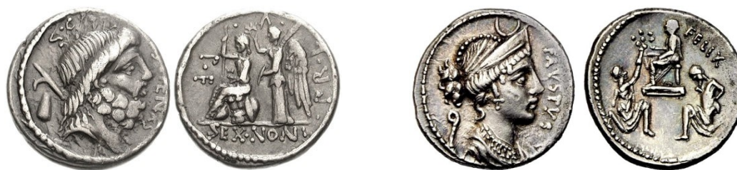
Denarios RRC 421/1 y 426/1 respectivamente