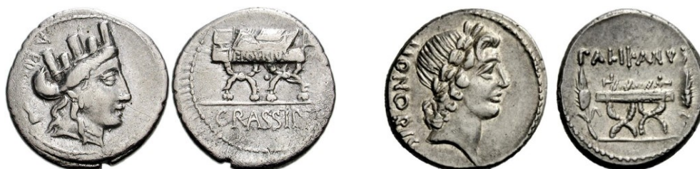
Denarios RRC 356/1a y RRC 473/2a respectivamente