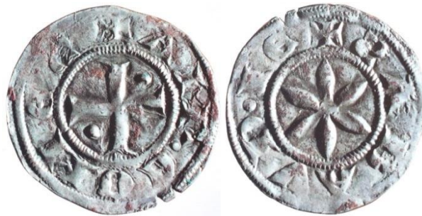
Fig. 9 : Denier fort de Chambéry au nom d'Amédée V (années 1285-1290,)