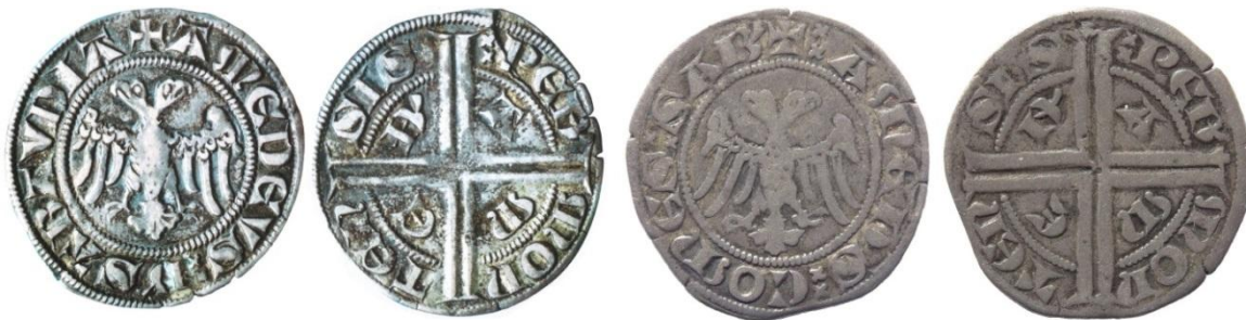
Fig. 22 : Double tiers de gros à la légende « AMEDEE DE SAVOIE » et double tiers de gros à la légende « PIEMONT », sans marque entre les deux têtes de l'aigle (ill. E. Biaggi (1.85g / 21.5mm) / coll. privée (2.10g/ 22mm)

Il existe enfin un exemplaire a priori unique d'un double tiers de gros du type piémontais. La légende ne comporte cependant pas le titre comtal, mais simplement « Amédée de Savoie » 93 . S'agit-il d'une erreur de gravure ? Comme nous l'avons constaté, l'atelier turinois, est dès Noël 1297 sous la direction de Durand Carrerie qui émet au nom de « Philippe de Savoie ». Or le compte du trésorier général de Savoie mentionne que ce dernier a également payé la concession de l'atelier de Suse pour cette année. Peut-être s'est-il agi d'une interversion de la part d'un graveur commun aux deux ateliers ? L'aigle bicéphale de cette monnaie possède un style particulier et ne comporte pas de signe entre les deux têtes, à l'instar de celle des monnaies flamandes de Marguerite de Constantinople, à l'instar également de certains doubles tiers de gros portant le titre comtal que nous serions tentés d'attribuer à Suse 94 . Pourtant le poids relativement léger de 1.85g, et le diamètre relativement faible de 21.5 mm laissent également à penser à une espèce différente qui n'aurait pas été émise en très grande quantité.