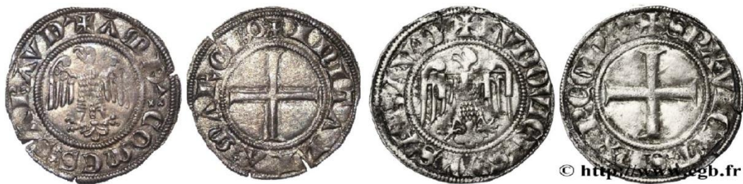
Fig. 15 : Gros d'Amédée V et de son frère Louis Ier, ce dernier portant un lambel (BnF (2.59g, 25 mm) / cgb.fr (2.53g/24 mm))

En ce qui concerne les gros émis par Amédée V, ils marquent une rupture avec le monnayage savoyard antérieur. C'est la première fois qu'apparaît la titulature complète du prince sur une monnaie : Amédée comte de Savoie et marquis en Italie . Les gros innovent également en arborant pour la première fois une aigle éployée. Il s'agit ici d'une aigle héraldique différente de celle des monnaies de l'évêque de Valence. Cette aigle de sable sur fond d'or qui constitue encore les armes de Philippe Ier, pourrait bien avoir été reprise brièvement par Amédée V en 1286, même si dès 1285 et pour le restant du règne, l'écu de gueules à croix d'argent sera arboré 80 . En revanche, ce sont bien les armes de Louis, le frère cadet d'Amédée, sire de Vaud, qui apparaissent sur les rares gros connus à son nom. Comme sur les sceaux de ce dernier, l'aigle porte un lambel 81 .