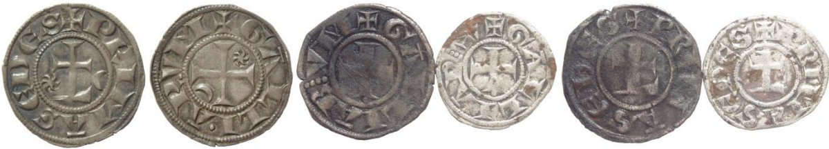
Fig. 5 : Denier fort d'argent, denier et obole forts neufs (MBAL 54 /coll. priv.)