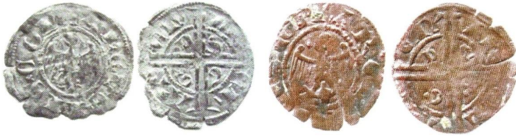
Fig. 28 : Deniers à l'aigle de l'archevêque d'Arles, la tête orientée à droite et à gauche (Ill. Chareyron 2006 et 2011)

Flandre à partir de 1296. Ils avaient proposé une datation des émissions archiépiscopales entre 1305 et 1315, émettant également l'hypothèse que les lettres G et D aient pu constituer les initiales de l'archevêque Galhard de Faugères (1311-1317).