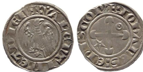
Fig. 13 : Gros à l'aigle de l'évêque de Valence Jean de Genève, (coll. priv.)