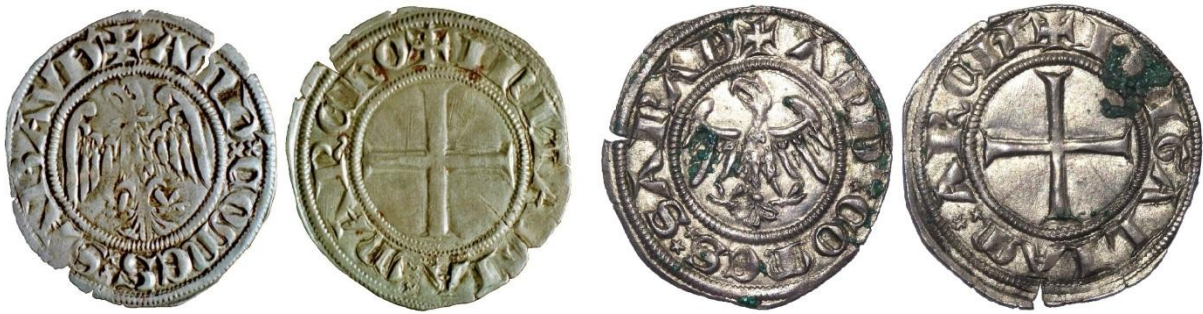
Fig. 25 : Gros à l'aigle avec et sans plumes dans le cou, avec les croisettes ou les étoiles dans la légende et les deux variantes SABAVD' et SABAD'. (Coll. priv. et BnF)

Nous ne disposons en revanche d'aucun résultat d'essai pour les double tiers de gros. Si leur provenance est déjà indiquée par la présence de la mention « Savoie » ou « Piémont », il est peut-être possible de la préciser davantage à l'aide des signes distinctifs. A l'image de la monnaie à la légende « AMEDEVS DE SABAVDIA », nous pensons que les monnaies ne présentant pas de point ou de marque entre les deux têtes sont à attribuer à l'atelier de Suse. Les autres double tiers de gros de type piémontais ont vraisemblablement été émis à Avigliana. En ce qui concerne les monnaies au type « Savoie », la présence de l'étoile entre les deux têtes de l'aigle marque l'émission à Chambéry (Fig. 20). Un cliché d'un double tiers de gros type « Savoie » montre une monnaie d'un aloi visiblement assez faible. Or le compte d'atelier de Chambéry de juillet à octobre 1300 mentionne la production de trois types de gros, dont, le contingent le plus important est, avec 799 marcs produits, celui des gros Aquilini à 5 deniers d'aloï. A notre avis, il faut identifier ces aquilini avec les doubles tiers de gros. Sous réserve d'équivalence, si l'on se réfère au bail de 1297 pour Turin, en moins de trois ans l'aloï de ces monnaies est passé de 8 deniers et obole (70.8 % d'argent) à seulement 5 deniers (41.7 %). Ce ne sont alors plus des monnaies d'argent mais des monnaies de billon.