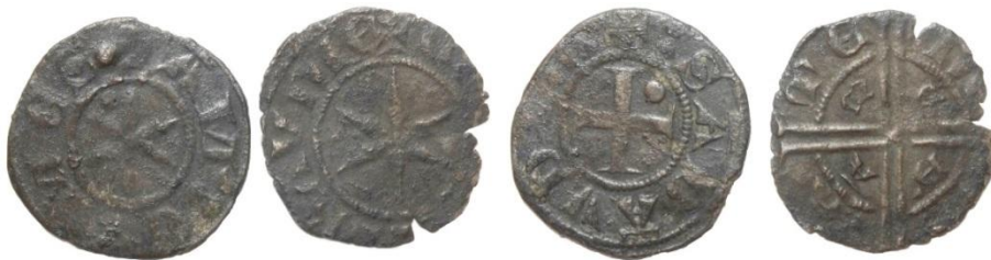
Fig. 31 : Le « nouveau » denier viennois et l'ancien fort blanchet (MBAL)

D/ +AM' (signe) COMES , molette d'éperon, un ou deux globules R/ + (signe) SABAVDIE (signe) croix cantonnée d'un globule au 2e canton