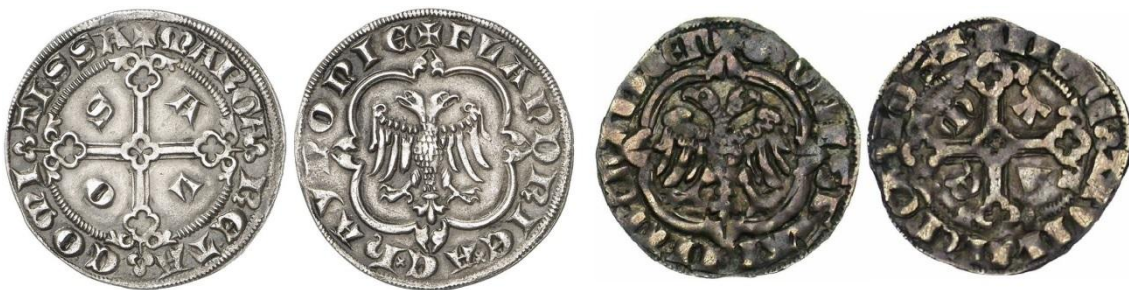
Fig. 19 : Double tiers de gros de Marguerite de Constantinople et demi gros de Gui de Dampierre

Enfin, la monnaie la plus spectaculaire est sans aucun doute le double tiers de gros à l'aigle bicéphale. Ce type est initialement créé en 1275 par la comtesse de Flandre et de Hainaut Marguerite de Constantinople qui demanda que soient émis pour la Flandre, à Alost, des gros deniers tels que trois d'entre eux vailent en poids, loi et taille, deux gros tournois du roi de France 90 . Ces doubles tiers de gros porteront l'aigle bicéphale, emblème plutôt rare en Occident, traditionnellement attribué aux empereurs byzantins, mais déjà utilisée sur certaines mailles flamandes. Gui de Dampierre, fils et héritier de Marguerite pour la Flandre émettra également à ce type, mais en le dévaluant très probablement. Ce type sera aussi imité par le comte Henri VII de Luxembourg, beau-frère d'Amédée V depuis 1297-1298, et futur empereur.