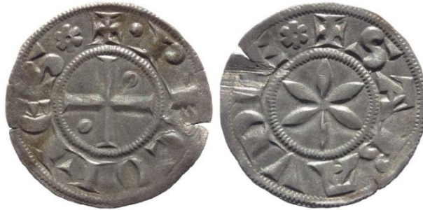
Fig. 8 : Denier fort neuf de Chambéry émis sous Philippe Ier (1.09g, 19 mm, coll. priv.)

l'interdiction de commercer avec l'ancienne monnaie 64 . Cette même année 1272, le châtelain d'Avigliana rend compte d'un messenger envoyé au comte pour la nouvelle monnaie 65 . Ce passage a été interprété comme la preuve de l'existence de l'atelier d'Avigliana, mais rien, à notre connaissance, ne permet d'affirmer ce point. Il peut simplement s'agir d'un messenger envoyé pour connaître les conditions de circulation de cette monnaie neuve. Le fort de Chambéry est mentionné dans le compte du châtelain de Lompnes en 1273, qui relève à cette occasion qu'un fort de Chambéry vaut deux viennois 66 . En tout état de cause, cette réforme fait encore parler d'elle quelques années plus tard, puisqu'en 1278-1279, le châtelain de Tarentaise mobilise trois clients pour procéder à une opération de change, sans doute afin d'éradiquer définitivement les derniers forts vieux 67 . Cette opération est d'ailleurs menée conjointement avec le châtelain de l'archevêque de Tarentaise.