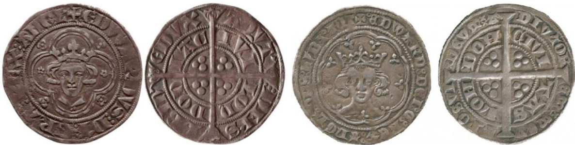
Fig. 32 : Groat d'Edouard I (1272-1307) et d'Edouard III (1327-1377) (Baldwin 2014)

En outre, même si cet argument est à manier avec précaution, le style et l'épigraphie semblent plus proches de ceux des monnaies du début du XIV e siècle, et plus précisément des viennois que nous proposons de reconnaître avoir été émis à partir de 1300. De plus, ce type pourrait correspondre à la mention de fabrication d'un troisième type de gros dans le compte d'atelier de Chambéry. Enfin, un autre détail est pour le moins gênant : sur les monnaies d'Edouard III, le portrait du roi est entouré d'un polylobe, alors que sur la monnaie savoyarde il est dans un quadrilobe. Or ce quadrilobe se retrouve bien sur une monnaie anglaise, en l'occurrence le premier groat , gros de quatre esterlins, créé Outre-Manche en 1279, par Edouard I er . Cette monnaie anglaise n'a cependant pas connu un succès important, du fait de la forte valeur de l'esterlin, mais elle courait encore au moins en 1295 111 .