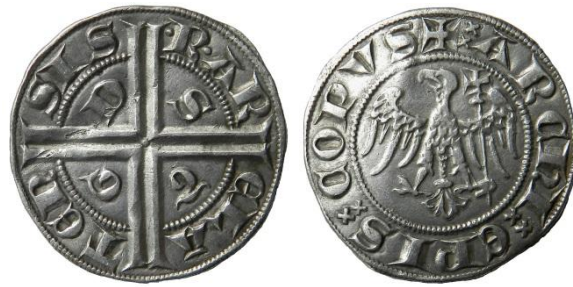
Fig. 29 : Double tiers de gros de l'archevêque d'Arles (coll. priv.)

D/ .R. ARELA TEN SIS , croix double coupant la légende, cantonnée de S T G D R/ + ARCHIEPISCOPVS , aigle aux ailes éployées tête à gauche tenant de l'aile gauche une haste surmontée d'une croix