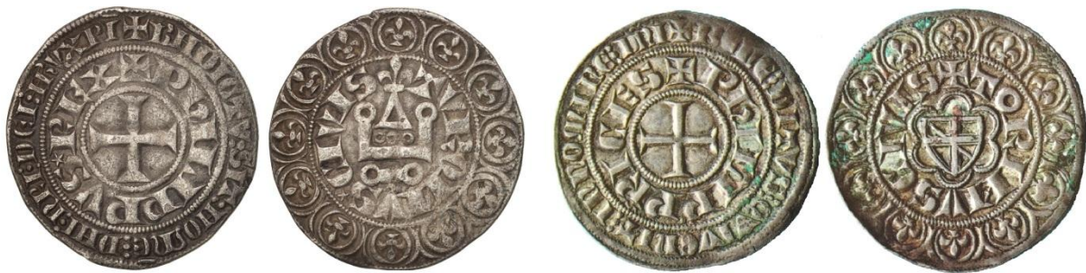
Fig. 34 : Gros tournois à la fleur de lis de Philippe IV le Bel et gros tournois de Philippe de Savoie, sire de Piémont et prince d'Achaïe.

Cette émission savoyarde de « gros tournois » a sans doute entraîné l'adaptation des monnaies émises par son neveu Philippe à Turin, puisque l'atelier transalpin se met à émettre des gros au type tournois, dont quelques exemplaires sont connus. C'est également probablement à cette période qu'Asti entamera la frappe de gros tournois, tandis qu'en mars 1307, Charles II d'Anjou ordonne la frappe de gros tournois « comme ceux du temps de St Louis » à Coni 122 .