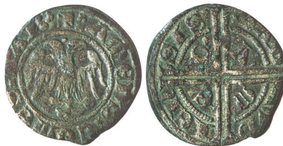
Fig. 26 : Double tiers de gros de faible aloï, probable « aquilino » du compte de 1300

Nous ne disposons en revanche d'aucun résultat d'essai pour les double tiers de gros. Si leur provenance est déjà indiquée par la présence de la mention « Savoie » ou « Piémont », il est peut-être possible de la préciser davantage à l'aide des signes distinctifs. A l'image de la monnaie à la légende « AMEDEVS DE SABAVDIA », nous pensons que les monnaies ne présentant pas de point ou de marque entre les deux têtes sont à attribuer à l'atelier de Suse. Les autres double tiers de gros de type piémontais ont vraisemblablement été émis à Avigliana. En ce qui concerne les monnaies au type « Savoie », la présence de l'étoile entre les deux têtes de l'aigle marque l'émission à Chambéry (Fig. 20). Un cliché d'un double tiers de gros type « Savoie » montre une monnaie d'un aloi visiblement assez faible. Or le compte d'atelier de Chambéry de juillet à octobre 1300 mentionne la production de trois types de gros, dont, le contingent le plus important est, avec 799 marcs produits, celui des gros Aquilini à 5 deniers d'aloï. A notre avis, il faut identifier ces aquilini avec les doubles tiers de gros. Sous réserve d'équivalence, si l'on se réfère au bail de 1297 pour Turin, en moins de trois ans l'aloï de ces monnaies est passé de 8 deniers et obole (70.8 % d'argent) à seulement 5 deniers (41.7 %). Ce ne sont alors plus des monnaies d'argent mais des monnaies de billon.