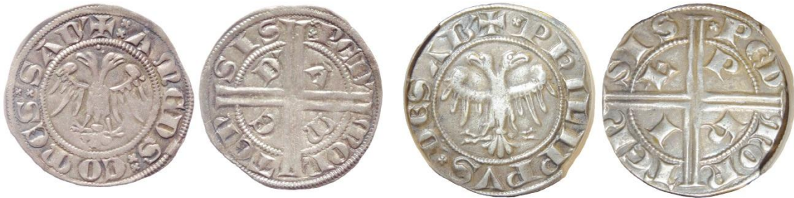
Fig. 21 : Doubles gros d'Amédée V et de Philippe de Savoie pour le Piémont (Bnf (2.32g /23 mm) / Musée Savoisien)

D/ + * AMEDS * COMES * SAB' , aigle bicéphale, étoile entre les deux têtes R/ *SA BAV DIE SIS , croix double coupant la légende et cantonnée des lettres A M E D'