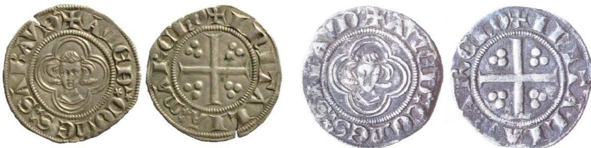
Fig. 33 : Gros au portrait du comte Amédée V. (coll. priv / ill. E. Biaggi. 1.87 à 2.16 g, 23 mm)

En regard des liens qui unissent Amédée à son cousin Edouard en ce tout début du XIV e siècle, il n'est pas très surprenant que le comte ait adapté un type dont de nombreux exemplaires ont sans doute traversé la Manche en direction de la Savoie à chaque retour d'Angleterre du comte. La couronne royale est toutefois remplacée par une couronne de fleurs, à l'instar des esterlins contemporains émis en Hainaut. Il est en revanche plus difficile de se représenter le cours de cette monnaie. Les poids relevés de 1.87 g et 2.16 g la rapprochent des double tiers de gros à l'aigle bicéphale.