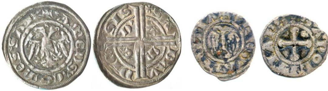
Fig. 20 : Double tiers de gros d'Amédée V type « Savoie », obole de Valence à l'aigle bicéphale (ill. E Biaggi / coll. priv.)

cette figure 91 . Il existe également une monnaie de l'évêché de Valence probablement émise sous la procuration de Philippe arborant cette aigle 92 .