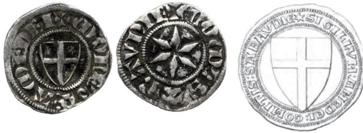
Fig. 35 : Viennois à l'écu et sceau utilisé en 1287 (Collection privée, 0.79 g, 16 mm / ill. Promis 1834 n° 36)

« SIGILLVM AMEDEI COMITIS SABAVDIE », la monnaie présente l'écu orné de la légende « MONETA AMEDEI COM'(itis) SABAVDIE » se déroulant sur les deux faces 129 .