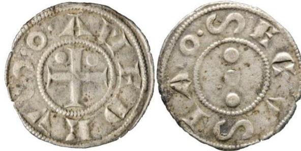
Fig. 10 : Denier sécusain au nom d'Amédée V (Coll. priv.)

deniers de Suse avec des gros à l'aigle bicéphale que nous décrivons plus avant (Fig. 22), nous avons constaté une très grande proximité de certaines lettres, notamment les A et les C, qui sont visiblement de la même facture. Cela permet de repousser l'émission du denier sécusain jusqu'aux premières années du règne d'Amédée V. Les caractéristiques de ces deniers (masse de 0.64g et diamètre de 16 mm) sont par ailleurs concordantes avec la valeur qui leur semble accordée, celle d'un denier viennois.