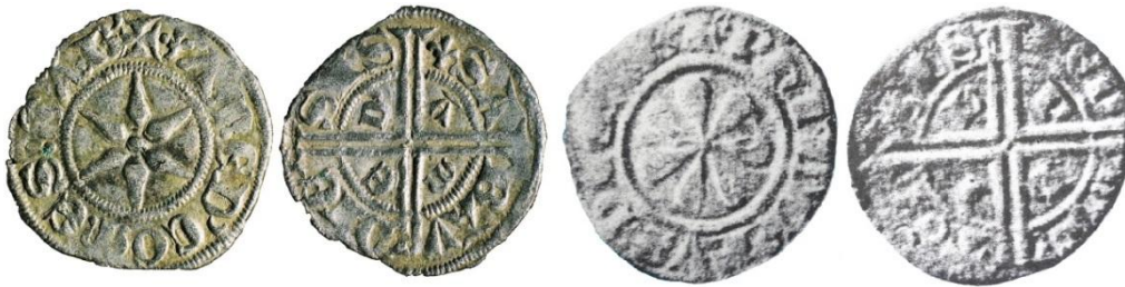
Fig. 18 : Denier fort blanchet à la légende « SAVOIE » et denier de Philippe de Savoie (coll. priv./)

Enfin, la monnaie la plus spectaculaire est sans aucun doute le double tiers de gros à l'aigle bicéphale. Ce type est initialement créé en 1275 par la comtesse de Flandre et de Hainaut Marguerite de Constantinople qui demanda que soient émis pour la Flandre, à Alost, des gros deniers tels que trois d'entre eux vailent en poids, loi et taille, deux gros tournois du roi de France 90 . Ces doubles tiers de gros porteront l'aigle bicéphale, emblème plutôt rare en Occident, traditionnellement attribué aux empereurs byzantins, mais déjà utilisée sur certaines mailles flamandes. Gui de Dampierre, fils et héritier de Marguerite pour la Flandre émettra également à ce type, mais en le dévaluant très probablement. Ce type sera aussi imité par le comte Henri VII de Luxembourg, beau-frère d'Amédée V depuis 1297-1298, et futur empereur.