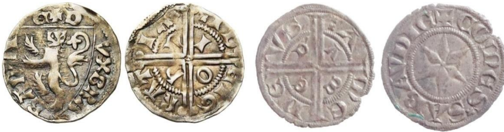
Fig. 17 : denier esterlin de Jean de Brabant, denier fort blanchet de Savoie

« PEDMONTENSIS » (Piémont). Il diffère néanmoins de celui de son oncle par la présence d'une fleur à la place de l'éperon.