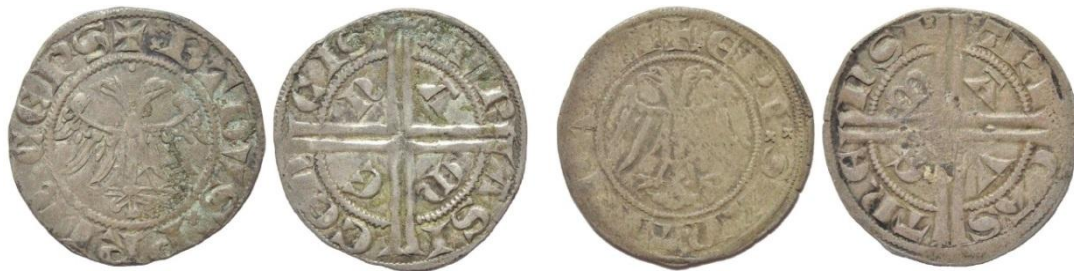
Fig. 27 : Doubles tiers de gros de Bertrand prince d'Orange et de l'évêque de Saint-Paul-Trois-Châteaux (MBAL, 2.25 g / 22 mm, 2.18 g / 22 mm)

Profitant de ce flux monétaire, le prince d'Orange Bertrand III (1282-1314) et l'évêque de Saint-Paul-Trois-Châteaux Guillaume d'Aubenas (1293-1309) vont ainsi copier les doubles tiers de gros à l'aigle bicéphale savoyards, sans doute dans les années 1297-1300. Ils en adaptent les légendes, remplaçant AMEDEUS COMES SABAUDIE par BERTRANDVS PRINCEPS et EPISCOPI SANTI PAVLI. Au revers, AVRASICENSIS et TRICASTNENSI sont substitués à SABAVDIENSIS ou PEDMONTENSIS et les quatre lettres cantonnant la croix double sont respectivement remplacées par A M E N et A V E M(aria) 100 .