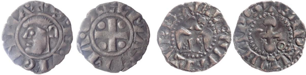
Fig. 4 : Deniers de Vienne et de Valence, années 1240 51

Dans les années 1240, la monnaie en vogue dans l'espace rhodanien est le denier viennois dont l'utilisation s'étend de la Méditerranée au nord de la Franche-Comté. Ce denier viennois, produit en de grandes quantités, est au cœur d'un système reliant plusieurs monnaies par des jeux d'équivalences simples. Ainsi, dans les années 1240-1270, un denier de Vienne est équivalent à un denier de Valence, de Clermont, de Langres ou de Marseille. Il vaut en outre deux deniers du Puy, de Viviers ou encore deux deniers de ceux que le duc de Bourgogne émet à Dijon 50 .