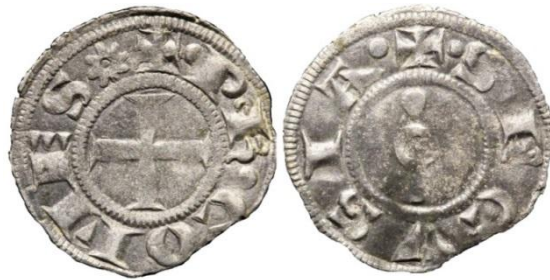
Fig. 7 Denier de Suse de Philippe Ier (collection privée)

Sous le règne de Philippe, les émissions à Suse et à Saint-Maurice d'Agaune se poursuivent. En effet, quelques rares deniers sécusains à son nom sont connus. En mai 1274 Philippe déclare promettre au chapitre cathédral de Sion de lui présenter la monnaie qu'il fait ouvrir à Saint-Maurice et de le consulter sur le change des autres monnaies courant en la vallée : viennois, forts de Lyon et royaux coronats 59 . Cette promesse semble tenue, puisqu'en 1278 le maître de la monnaie de Saint-Maurice monte à Sion présenter sa production 60 .