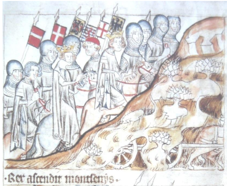
Fig. 1 : Le comte Amédée V accompagnant son beau-frère Henri VII « roi d'Allemagne » lors de son voyage pour son couronnement impérial à Rome fin 1310. La scène représente l'ascension du col du Mont-Cenis. Amédée est le personnage aux cheveux gris représenté en quatrième position du cortège par ordre d'importance, sous la bannière de gueules à croix d'argent. A cette date le comte est âgé de 57 ans 3 .