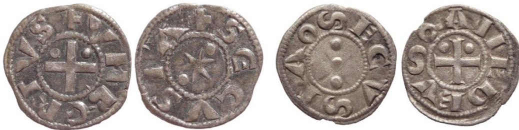
Fig. 6 : Monnaies de Suse : denier fort et denier sécusain (coll. priv.)

Sur le plan monétaire, l'atelier principal des comtes de Savoie est, depuis le XIIe siècle, situé à Suse, sur le versant oriental des Alpes, au carrefour des routes internationales débouchant par les cols du Montgenèvre et du Mont-Cenis. Cet atelier émet deux types différents : le denier fort et le denier sécusain. L'autre atelier est celui de Saint-Maurice d'Agaune en Chablais, opérant sur la route du Grand Saint-Bernard. Cependant, la diffusion des monnaies émises par cette dernière officine semble limitée à la Haute Vallée du Rhône et aux alentours du Léman.