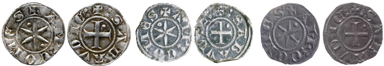
Fig. 30 : Denier fort et deniers viennois à l'éperon probablement émis dès 1300 (coll. priv et BnF (1.85g / 17 mm))

Le compte de production de l'atelier de Chambéry de juillet à octobre 1300, mentionne la production de 2010 marcs de deniers viennois, qui sont probablement ces nouveaux « bons viennois ». Nous pensons les avoir identifiés aux travers des deniers suivants, très proches de ceux de la période 1290-1297, mais dont l'épigraphie paraît plus soignée, peut-être plus récente. Ces deniers étaient encore une fois attribués à Amédée IV, mais, pour les mêmes raisons qu'avancées plus avant elles doivent voir leur période d'émission repoussée au règne d'Amédée V 109 . Si l'on doit se référer aux monnaies que nous avons recensées, très peu de forts semblent avoir été émis. Si les légendes sont identiques, en revanche, leur position est inversée par rapport à celle des forts et viennois des années 1290-1297 : le nom du comte est désormais du côté de l'éperon. En ce qui concerne les deniers forts, les globules sont désormais placés entre les branches de l'éperon à 5 et 11 heures. Nous avons relevé pour ces derniers des poids s'échelonnant de 0.88 à 0.98 g, pour un diamètre de 18 à 20 mm, alors que pour les viennois nous avons trouvé une moyenne de 0.71 g pour un diamètre moyen de 17 mm. On remarque également la présence de marques distinctives : sur les forts et une partie des viennois, ce sont de séries de deux roses, tandis que sur le reste des viennois ce sont des séries de trois étoiles.