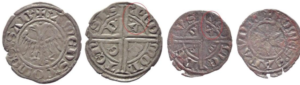
Fig. 24 : Double tiers de gros de Piémont et denier fort présentant les mêmes marques

Seul un relevé intégral des variations de légende permettra peut-être de faire la part entre différentes émissions et les lieux de ces émissions. Hormis les types « Savoie », les légendes des deniers forts présentent en effet trois variantes principales. La légende COMES SABAVDIE se décline sous deux autres formes : COMES SABADIE et COMES SABAD'. Les deniers portant cette dernière légende présentent très souvent au revers une étoile, qui est la marque traditionnellement rattachée à l'atelier de Chambéry.