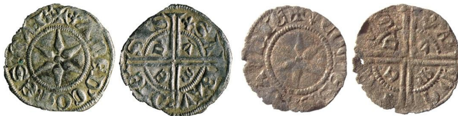
Fig. 23 : Deniers au différent à la fleur de lis. Le premier comporte la légende « SABAVDIESIS » le second « COMES SABAVDIE ». (coll. priv., 0.87g /18 mm, 0.52g /16 mm)

Les deniers à la légende « SABAVDIESIS » semblent systématiquement présenter un différent en forme de fleur de lis. Il s'agit là sans doute d'un différent du maître d'atelier, qui se retrouve également sur certains deniers à la légende « COMES SABAVDIE ». Or nous n'avons pas recensé de mouvement de maître de Savoie vers la zone transalpine. Ces monnaies ont très probablement été émises dans la même officine, soit à Chambéry ou à Saint-Symphorien-d'Ozon, donc à l'ouest des Alpes. Encore faut-il nuancer à propos de ce dernier lieu, car Saint-Symphorien n'est pas officiellement situé en Savoie mais plutôt en Viennois. Il est en revanche possible de se demander, du fait de la présence de plusieurs rubriques intitulées « petits deniers » dans le compte de Chambéry, en admettant que ces deux deniers aient été émis dans le même lieu, s'il s'agit bien du même type. A l'image de cet exemple, il est cependant très probable que la production des deniers forts blanchets à la légende « COMES SABAVDIE » ait été réalisée des deux côtés des Alpes et non pas seulement en Piémont.