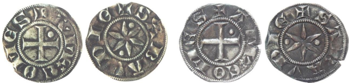
Fig. 12 : Deniers forts avec globules respectivement placés à 1 et 7 h et 3 et 9 h (ill. E Biaggi / Musée Savoisien 75 )

Les deniers forts présentent deux globules intercalés de façon diamétralement opposée entre les branches de l'éperon. Il semble y avoir une évolution dans les séries : sur les premières, les globules sont placés à 1 et 7 h. Dans un second temps, il y a une rotation dans le sens horaire, puisque les globules sont désormais placés à 3 et 9 h. Les viennois ne présentent en revanche qu'un seul globule intercalé entre les branches de la molette d'éperon. Il peut même ne pas y en avoir. On retrouve également la marque, généralement constituée de deux étoiles ou deux fleurs, intercalée entre le nom et la titulature.