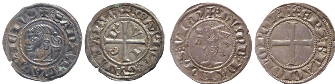
Fig. 14 : Gros des archevêques de Vienne et gros de pariage entre le dauphin Humbert Ier et l'évêque de Grenoble