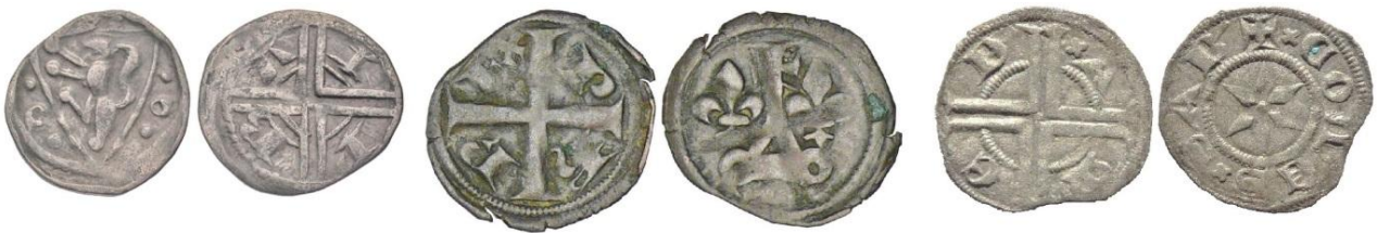
Fig. 16 : Maille d'Ypres (0.42g /11 mm), tournois simple de Philippe le Bel (0.50g / 15mm), viennois blanchet d'Amédée V (0.43 g /13.5 mm) (Agora Auctions / Monnaies d'Antan / coll. priv.)

Ainsi, la croix double cantonnée de quatre lettres du revers des mailles d'Ypres émises par Gui de Dampierre servira de référence au nouveau viennois, que l'on appellera bientôt « blanchet ». Du fait de son faible diamètre, ce type est généralement classé sous le nom d'obole 88 . Cependant, si l'on suit les dénominations savoyardes, il serait plus logique de lui attribuer le nom de viennois. Par cette croix cantonnée des quatre lettres A M E D', il rappelle également les demi doubles ou tournois simples émis par le roi de France à partir de 1295, monnaies de faible diamètre et dont la croix de revers est également cantonnée des lettres P-h- R-EX. En revanche, à l'avvers on retrouve l'éperon savoyard caractéristique.