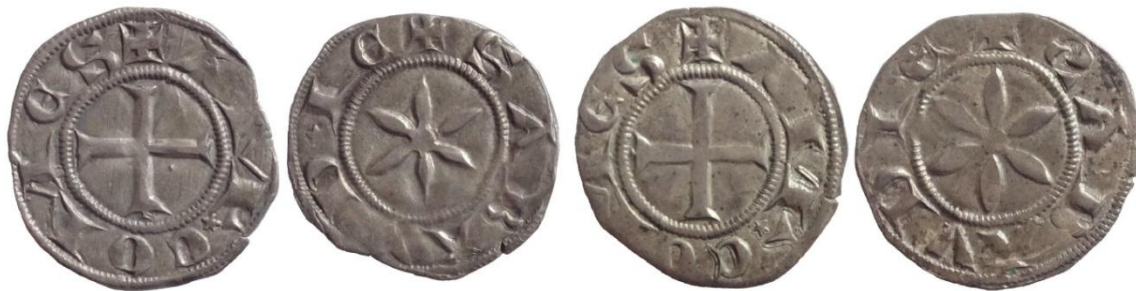
Fig. 11 : Deniers fort d'argent avec l'étoile (1.36 et 1.35g, 20 mm, BnF)

Dans cette première partie de règne semblent également avoir été émis des deniers forts d'argent à l'image de ceux émis par l'Eglise lyonnaise 72 . En effet ces monnaies sont très proches des deniers forts (de billon) décrits ci-dessus (Fig. 9). Cependant, les poids et diamètres relativement importants de ces monnaies, ainsi que leur visible bon aloi les rapprochent plutôt des forts d'argent émis par l'église de Lyon à partir des années 1270. L'épigraphie étant également plus tardive, nous proposons encore une fois d'attribuer ce monnayage à Amédée V plutôt qu'à son oncle Amédée IV, en cohérence avec le système lyonnais alors en vogue. C'est surtout la première fois qu'apparaît l'étoile en signe particulier. Cette étoile deviendra la marque caractéristique de l'atelier chambérien et figure encore aujourd'hui sur les armes de la ville.