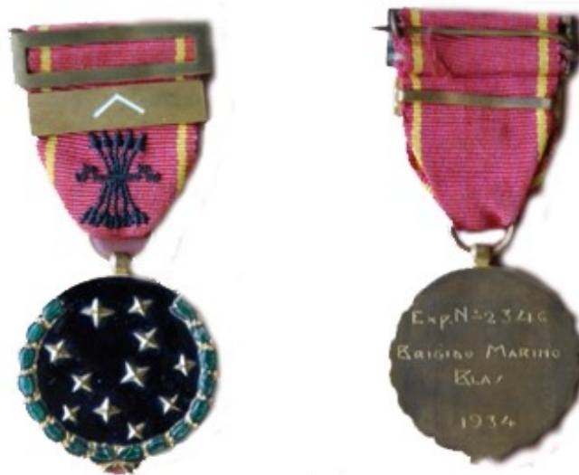
Figs. 2 y 3: anverso y reverso de la medalla

Hay que destacar que el diseño de la medalla así aprobado, que correspondería al anverso de la condecoración, en ningún momento fue descrito en ningún texto legal a diferencia del reverso y de los pasadores que debían ser colocados sobre la cinta, que, ya en el decreto de creación, fueron desarrollados. En efecto, el artículo 5º dice “ la medalla irá grabada por una sola cara que servirá de frente, dejando la otra para ser grabada sobre ella el nombre y los apellidos del concesionario, el número del carnet que acredite su calidad de Vieja Guardia y el año de filiación al Partido” El artículo 4º, por su parte, dice que los afiliados que antes del Movimiento 11 hubieran ostentado alguna jerarquía podrían llevar sobre la cinta de la medalla un pasador con el emblema correspondiente a dicha jerarquía, utilizando, en caso de varios cargos, el símbolo del más elevado. Además, los que hubieran pertenecido a Primera Línea, llevarían en el pasador el ángulo de plata correspondiente 12 . De aquí también se deduce que todos aquellos que hubieran pertenecido a la llamada Segunda Línea no ostentarían pasador alguno.