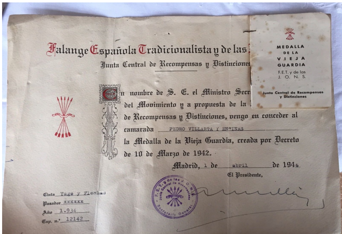
Fig. 4: diploma que se entregaba junto a la medalla

El 30 de agosto de 1942 se dictaron unas normas para la concesión, uso, pérdida, recuperación y prescripción de la medalla 14 . De esta norma podemos extraer las siguientes conclusiones: