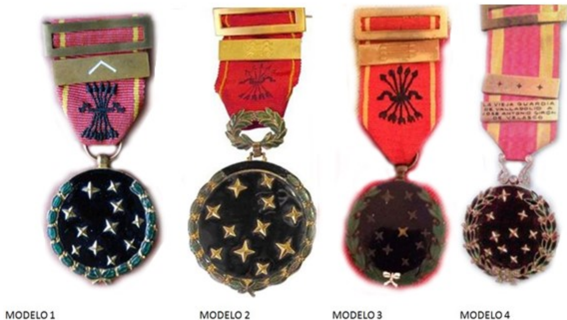
Fig.11 : Los cuatro modelos de la medalla de la Vieja Guardia

MODELO 1 : Es el modelo más común de medalla de la Vieja Guardia. Es opinión extendida dentro de la comunidad del coleccionismo de medallas que de su fabricación se encargó la empresa "Hijos de Juan Bautista Feu" 20 . Este extremo no lo he podido comprobar.