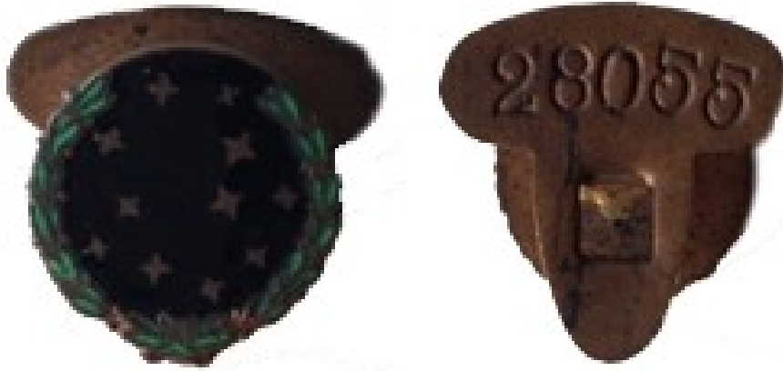
Figs. 5 y 6: botón para traje de paisano

3º La medalla era una distinción puramente honorífica.