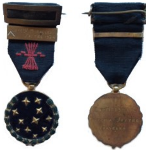
Figs. 7 y 8: Medalla con la « C » de Caído

El día 29 de octubre de 1942 en Madrid fue la primera vez que se realizó la imposición de la medalla a los familiares de los caídos 17 .