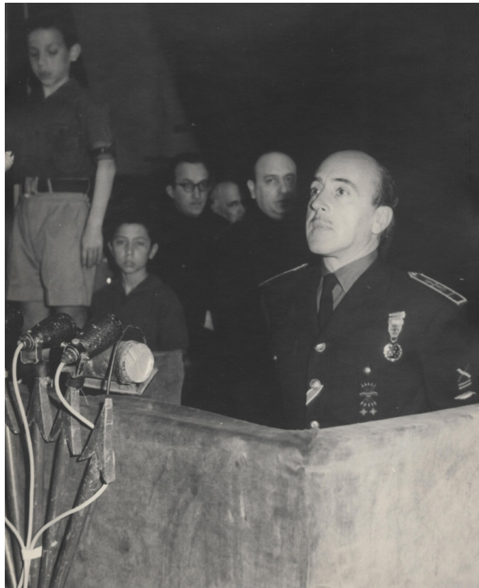
Fig.9: Militante con medalla de la Vieja Guardia