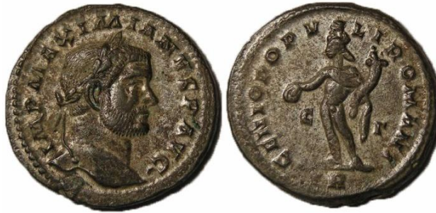
Type : GENIO POPVLI ROMANI

RIC. SUTHERLAND, C.H.V. & CARSON, R.A.G, Roman Imperial Coinage VI, From Diocletian's Reform (AD 294) to the Death of Maximinus (AD 313) , Londres 1967.