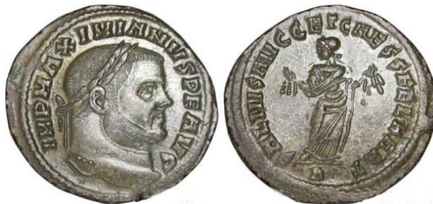
Type : SALVIS AVGG ET CAESS FEL KART