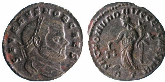
Type : SAC MON VRB AVGG ET CAESS NN