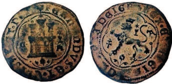
4 maravedís a nombre de los Reyes Católicos, ceca Cuenca. Colección particular.