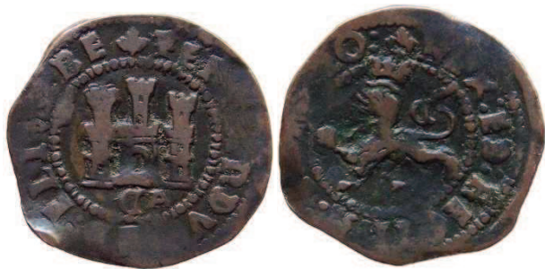
2 maravedís a nombre de los Reyes Católicos, ceca Cuenca. Colección particular.